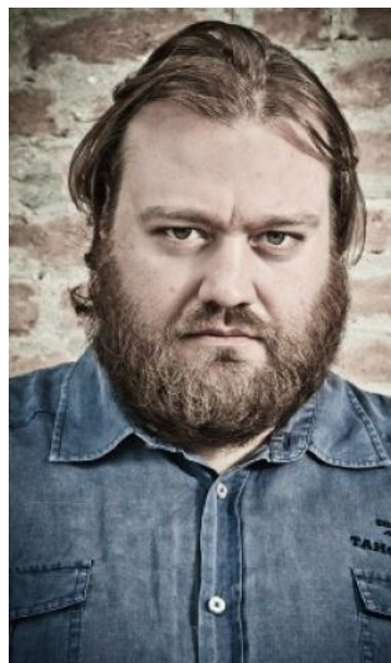
Barbora Bobulova & Stefano Fresi

Plusieurs avis ont été faits après avoir visionné le film :