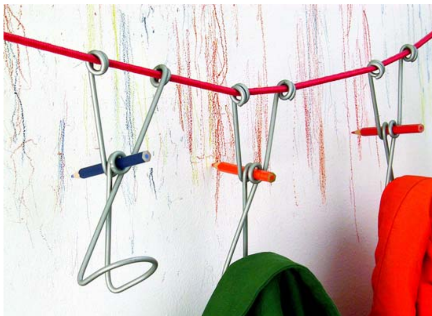
Document 4 : Emili Padros et Ana Mir , Slastic , 2010, porte manteau. Taille du cordon élastique : 1000 mm, édition La Moustache. Fil d'acier, élastique, acier laqué, crayons de couleurs.