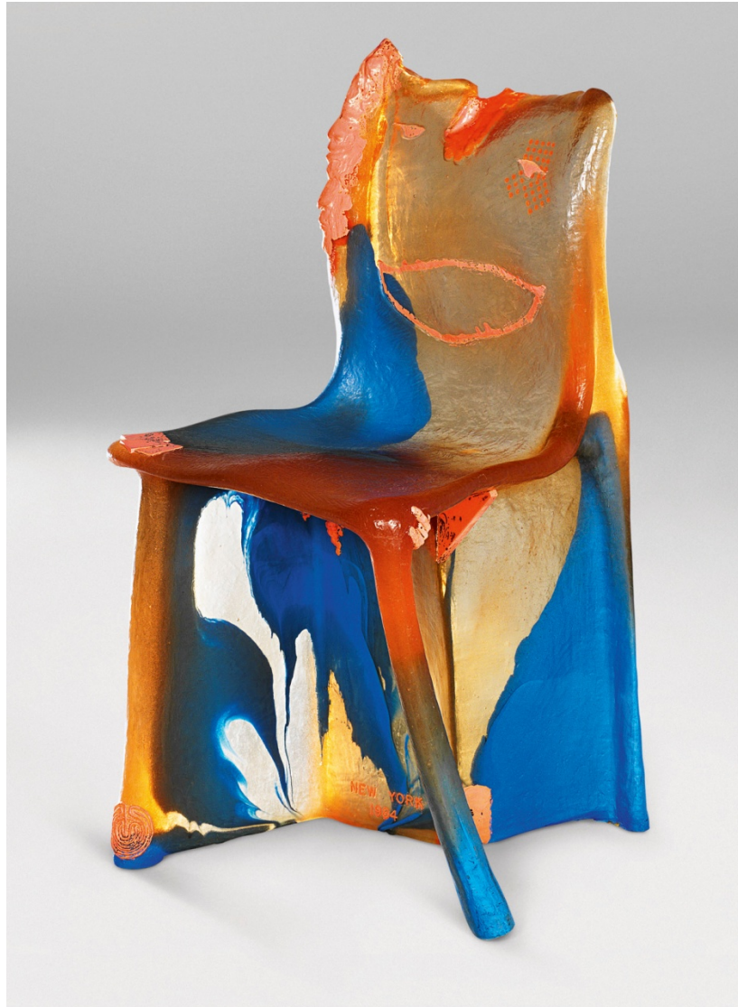
Document 1 : Gaetano Pesce , Pratt Chair , 1983-85, résine uréthane souple, série limitée de neuf exemplaires.