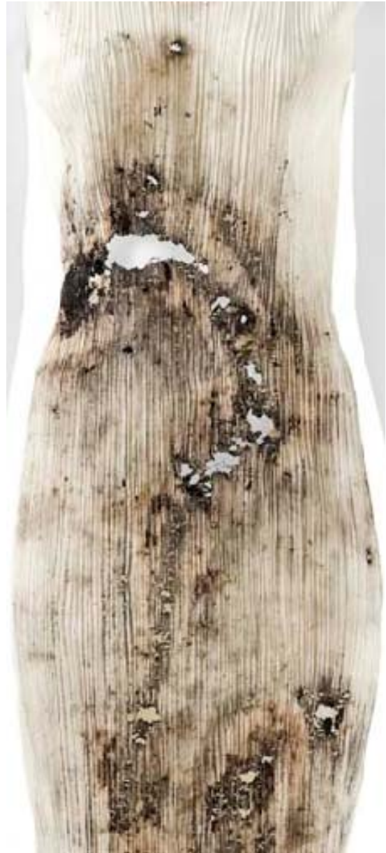
Document 2 : Cai Guo-Qiang , vêtement A de la collection Dragon : Explosion sur « Pleats Please » d'Issey Miyake , 1998. Vêtements brûlés à la poudre à canon, en vue du défilé d'Issey Miyake en 1998. 142.24 x 33.02 cm, Issey Miyake collection.