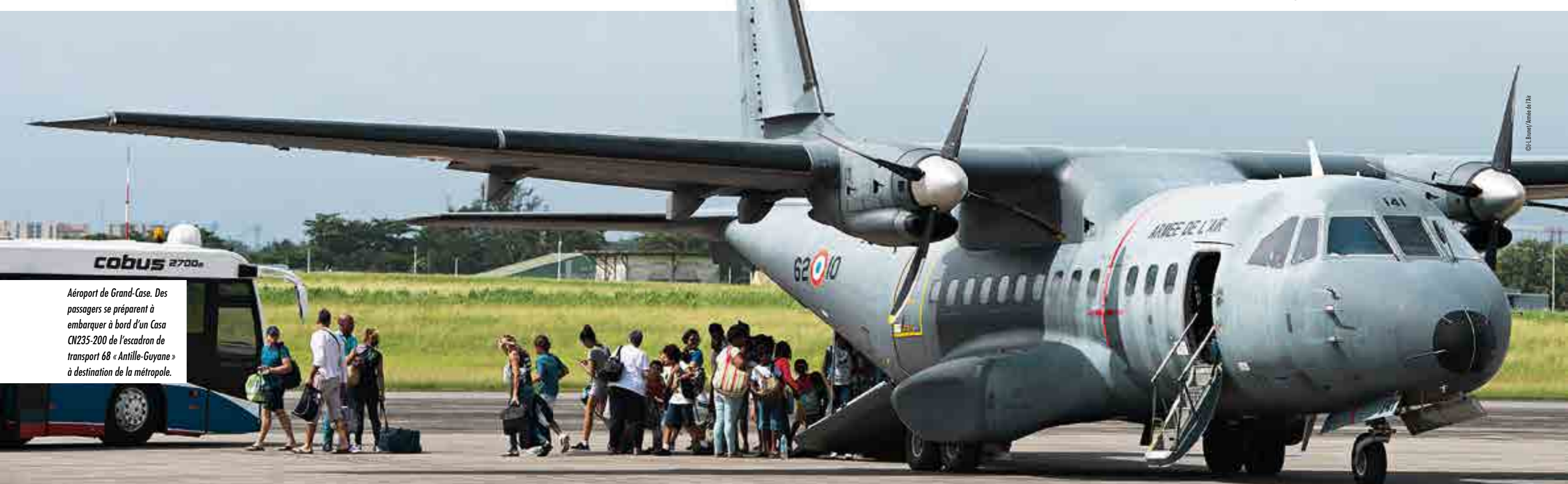
Aéroport de Grand-Case. Des passagers se préparent à embarquer à bord d'un Casa CN235-200 de l'escadron de transport 68 «Antille-Guyane» à destination de la métropole.