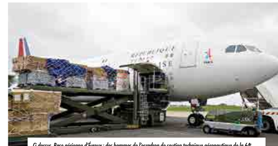
Ci-dessus. Base aérienne d'Évreux : des hommes de l'escadron de soutien technique aéronautique de la 64 e escadre embarquent du fret humanitaire à bord de l'A330 présidentiel, destiné aux victimes de l'ouragan Irma. Ci-dessous. Aéroport de Saint-Martin : des sapeurs pompiers chargent un Puma de l'ET 68 rotor tournant dont la mission est de ravitailler des sinistrés dans une zone inaccessible par la route.

Dans le même temps, un second Puma des FAG est également venu renforcer