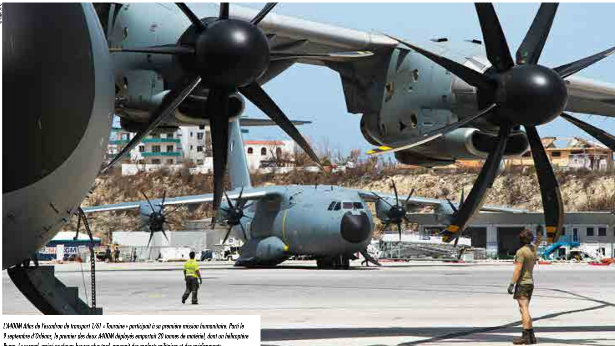
L'A400M Atlas de l'escadron de transport 1/61 « Touraine » participait à sa première mission humanitaire. Parti le 9 septembre d'Orléans, le premier des deux A400M déployés emportait 20 tonnes de matériel, dont un hélicoptère Puma. Le second, arrivé quelques heures plus tard, amenait des renforts militaires et des médicaments.

de conditions de vie décentes. Sur ces îles situées à plus de 250 km de la Guadeloupe et à plusieurs milliers de kilomètres de la métropole, les moyens aériens sont des vecteurs indispensables à l'acheminement des moyens matériels et humains. Équipes d'avions de transport et d'hélicoptères, convoyeurs de l'escadrille aérosanitaire « Étampes » et personnels d'escadrons de transit et d'accueil aérien de l'Armée de l'Air sont entrés en action.