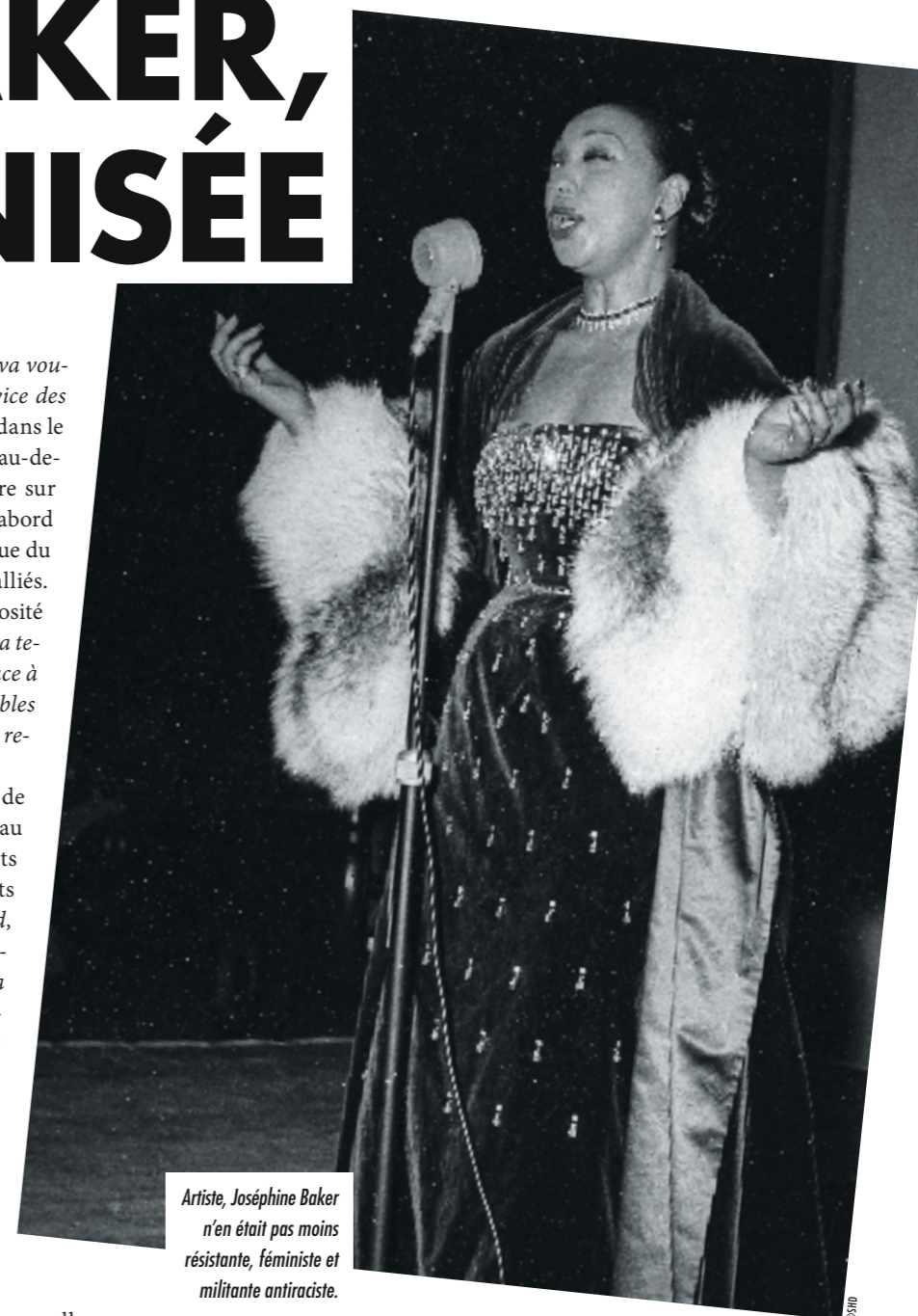
Artiste, Joséphine Baker n'en était pas moins résistante, féministe et militante antiraciste.