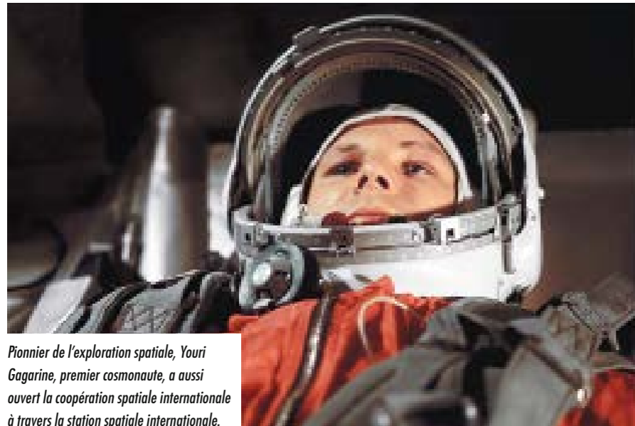
Pionnier de l'exploration spatiale, Youri Gagarine, premier cosmonaute, a aussi ouvert la coopération spatiale internationale à travers la station spatiale internationale.