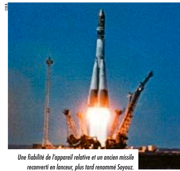
Une fiabilité de l'appareil relative et un ancien missile reconverti en lanceur, plus tard renommé Soyouz.