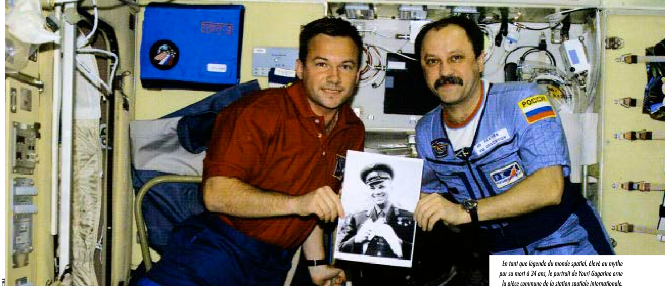
En tant que légende du monde spatial, élevé au mythe par sa mort à 34 ans, le portrait de Youri Gagarine orne la pièce commune de la station spatiale internationale.

sélectionné dans le cadre de la campagne de recrutement du programme spatial soviétique. À partir de septembre, je suis soumis à différents examens avant d'intégrer le programme d'entraînement secret en mars 1960. Rigoureux et appliqué, j'ai la chance de faire partie des vingt derniers candidats en lice. J'assiste à des cours et effectue un vrai entraînement opérationnel: sauts en parachute, centrifugeuses et autres mises en condition. Le 5 avril 1961, trois II-4 me conduisent avec les équipes au cosmodrome Baïkonour au Kazakhstan, l'une des républiques de l'Union soviétique. Ce cosmodrome se trouve en fait à Tiouratam, à 370 kilomètres de Baïkonour, afin de tromper "l'Occident capitaliste".