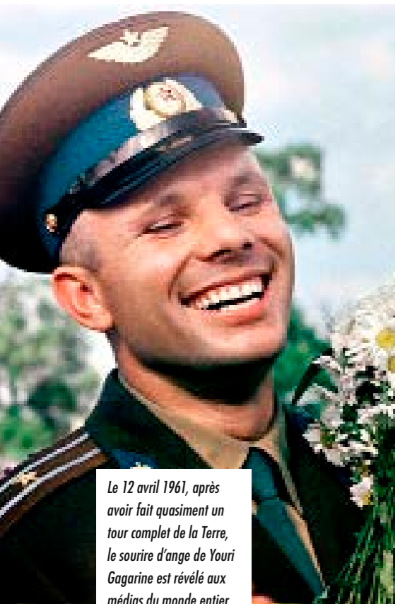
Le 12 avril 1961, après avoir fait quasiment un tour complet de la Terre, le sourire d'ange de Youri Gagarine est révélé aux médias du monde entier.

En pleine Guerre froide, pendant la course à l'espace entre les États-Unis et l'URSS, les Soviétiques envoient le premier homme en orbite, en ayant au préalable pris soin de dissimuler les préparatifs de la mission. Ce 12 avril 1961, quelques minutes après le décollage, la nouvelle se répand à travers le monde et les médias de la planète entière s'affairent pour annoncer cet exploit révolutionnaire. L'URSS a gagné cette étape de la course à l'espace. Youri Gagarine, âgé de 27 ans, entre dans l'histoire et devient un outil de la propagande soviétique.