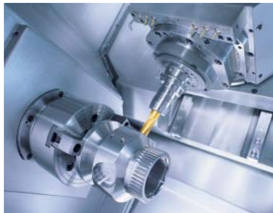
1 Usinage avec la GMX 200 de chez Linear

communication, mécanique, média, stage en entreprise