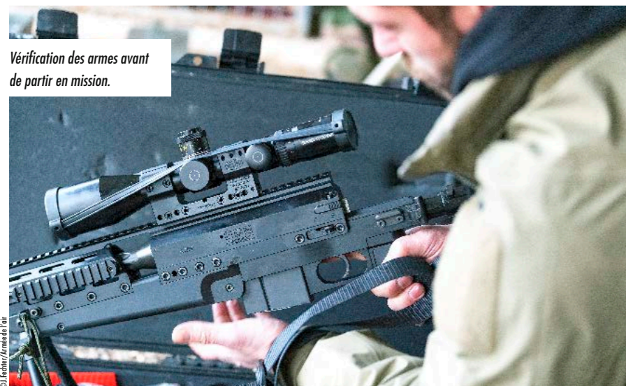
Vérification des armes avant de partir en mission.

pas tout seul dans ce périmètre. Les THP ont l'autorisation d'ouvrir le feu. La zone est dégagée et les conditions météo permettent des tirs efficaces et précis. Grâce à un tir synchronisé, les balles jaillissent et neutralisent le tireur embusqué adverse. Entre-temps, d'autres informations parviennent aux Aviateurs. Cinq autres terroristes vont essayer de récupérer le corps et surtout l'arme du sniper abattu en passant par un tunnel débouchant dans la carcasse du véhicule. Ils extraient rapidement les coordonnées géographiques des cibles.