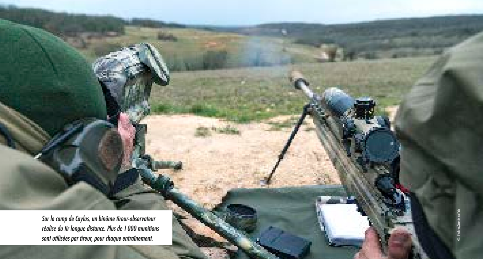
Sur le camp de Caylus, un binôme tireur-observateur réalise du tir longue distance. Plus de 1 000 munitions sont utilisées par tireur, pour chaque entraînement.