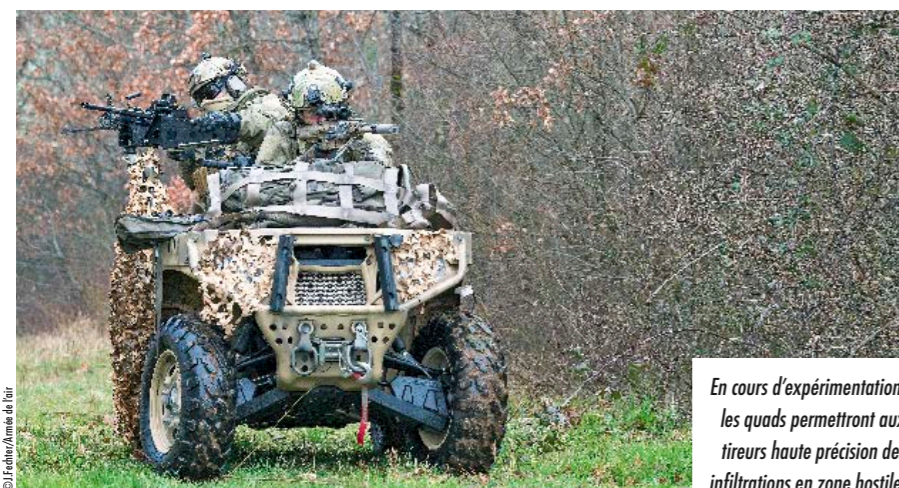
En cours d'expérimentation, les quads permettront aux tireurs haute précision des infiltrations en zone hostile.