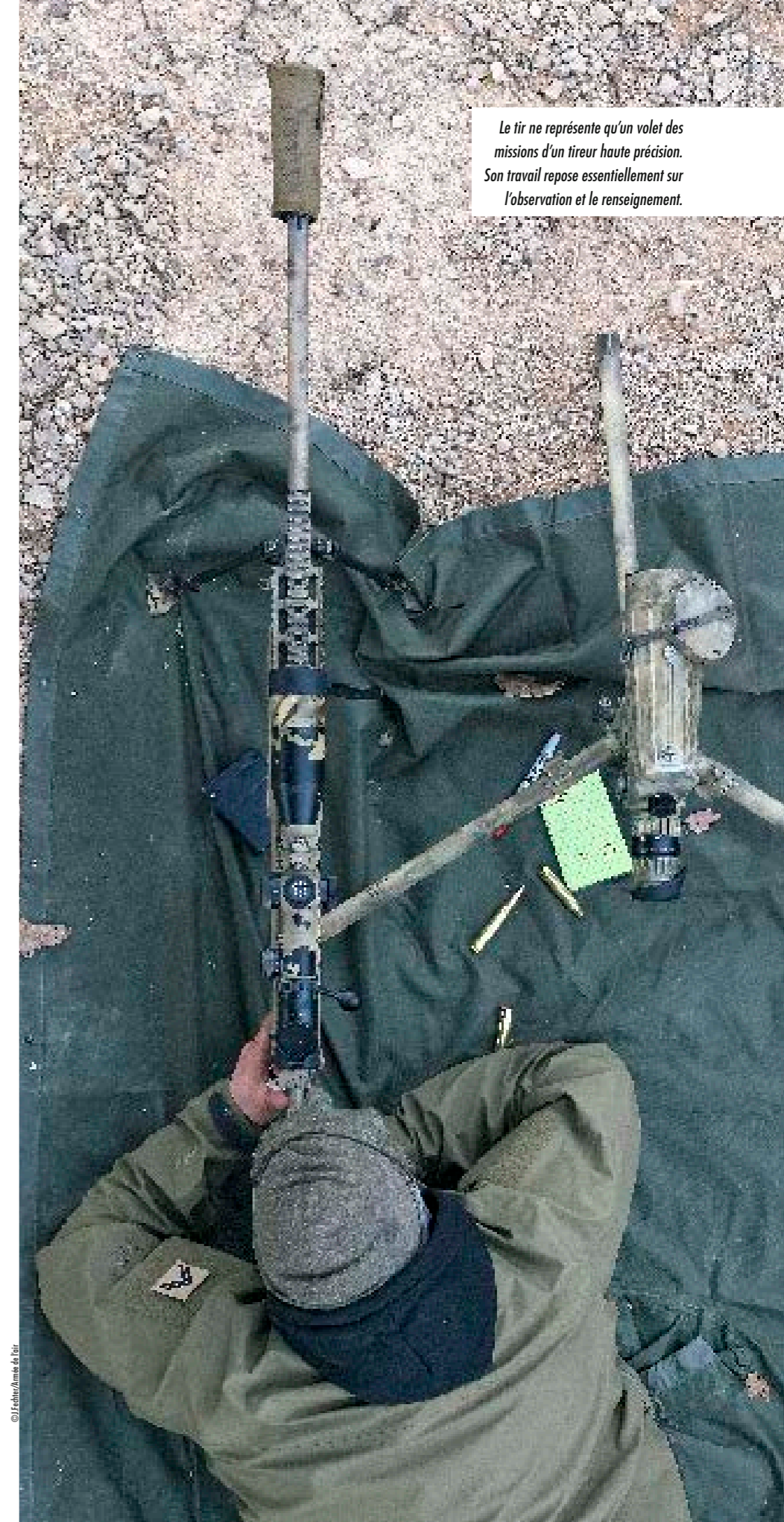
Le tir ne représente qu'un volet des missions d'un tireur haute précision. Son travail repose essentiellement sur l'observation et le renseignement.

La cellule THP va également se qualifier au saut opérationnel à grande hauteur (SOGH). En opérations, les tireurs pourront utiliser cette technique pour s'infiltrer en toute discrétion grâce aux équipages de l'escadron de transport 3/61 « Poitou ». « Il s'agit d'un enjeu important pour les THP. La cellule THP est en perpétuelle évolution pour s'adapter au mieux aux opérations actuelles », conclut le lieutenant-colonel Cyrille. ■