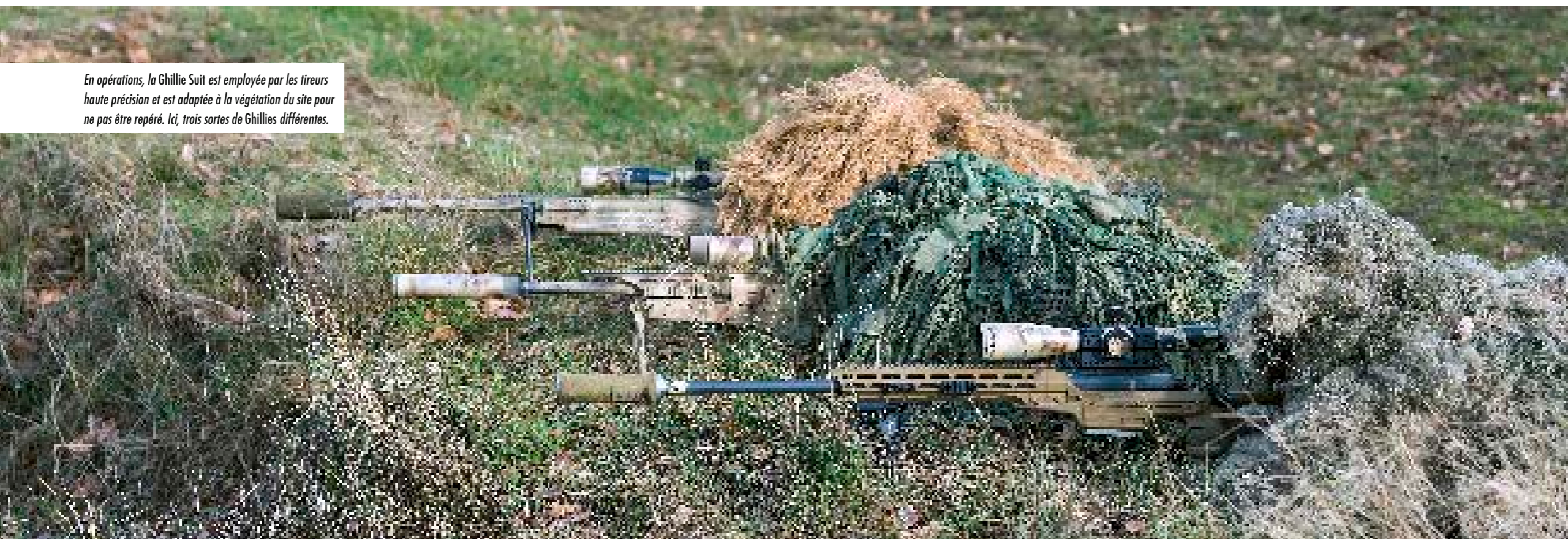
En opérations, la Ghillie Suit est employée par les tireurs haute précision et est adaptée à la végétation du site pour ne pas être repéré. Ici, trois sortes de Ghillies différentes.

Enfin, et ce point me tient particulièrement à cœur, je cherche à consolider au sein du CPA 10 une éthique du combattant qui sera très utile aux THP notamment.