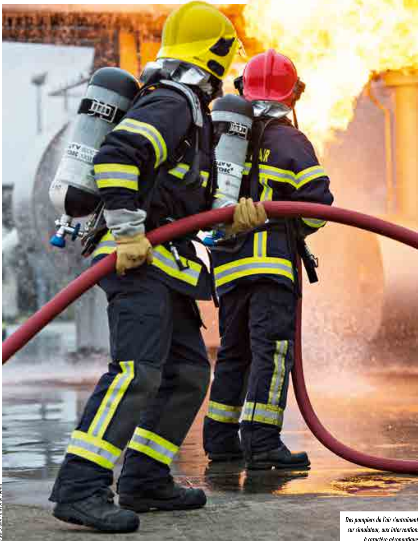
Des pompiers de l'air s'entraînent, sur simulateur, aux interventions à caractère aéronautique.