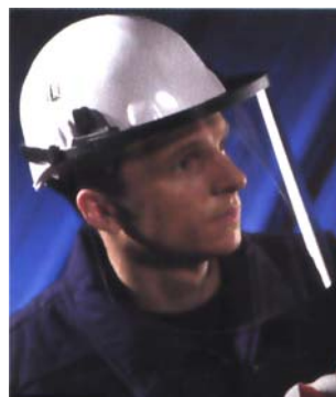
Ecran facial relevable sur monté sur casque