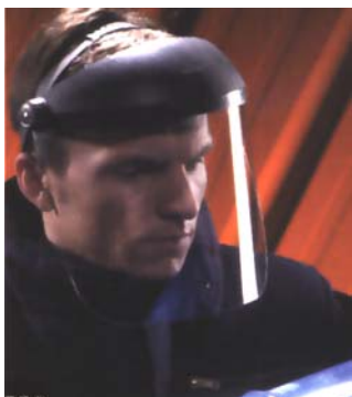
Ecran facial relevable sur serre tête

Documentation complémentaire: EN 166, document INRS ED 798 "les équipements de protection individuelle des yeux et du visage".