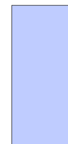
08 PRECOUPE PATTE.2/PEAU 1.07 dm 2