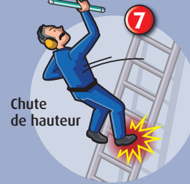
Chute de hauteur