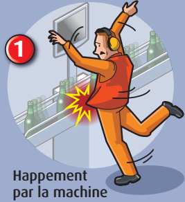
Happement par la machine