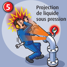
Projection de liquide sous pression