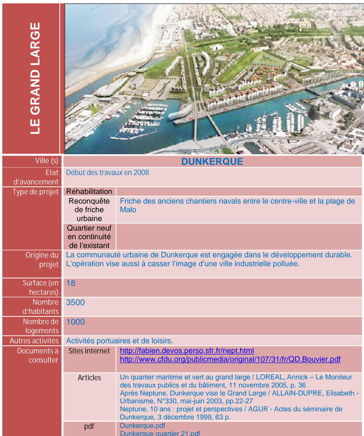
Tableau 1 : Présentation de l'éco quartier