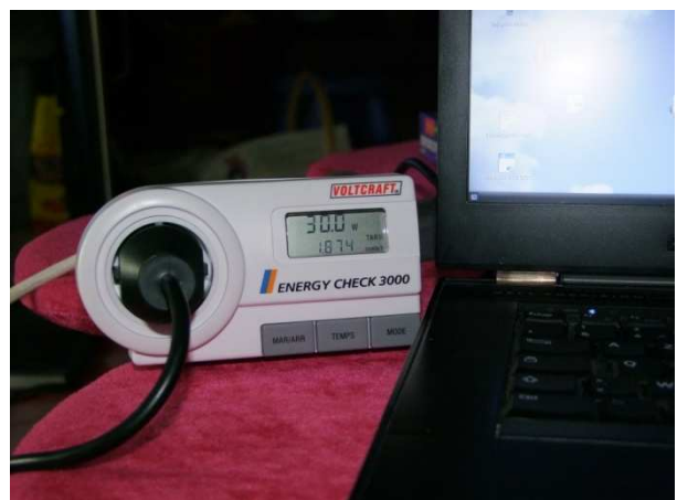
Un ordinateur portable 30W