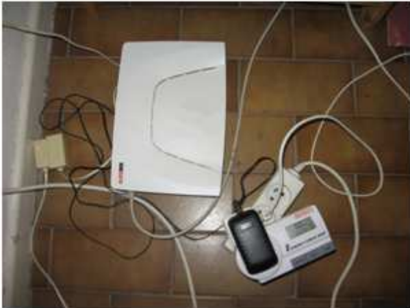
Une Box ADSL 6W

Pour mesurer la quantité d'énergie d'un appareil, il faut le brancher longtemps. Ceci est chronophage et pas forcément compatible avec un travail en temps limité. Il est souvent plus simple de mesurer la puissance que de mesurer la quantité d'énergie.