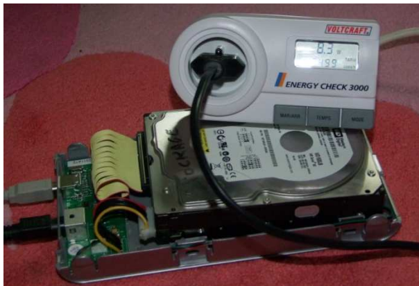
Un disque dur USB 8,3W