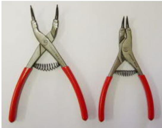
Pinces à anneaux élastiques