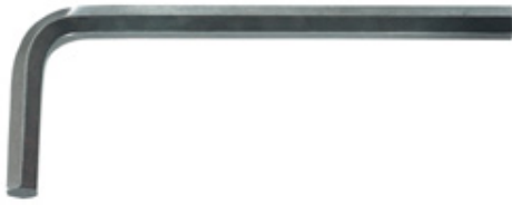
Clé 6 pans