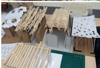
Photographies des travaux de Dnmade 1 ère année, 2020-2021.