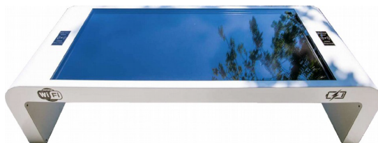
Photo du Banc solaire avec connectivité WI-Fi

Mise en situation : L'élève s'assoit sur le banc et souhaite se connecter au wifi proposé par le banc afin de ne pas utiliser son forfait qui est limité en données.