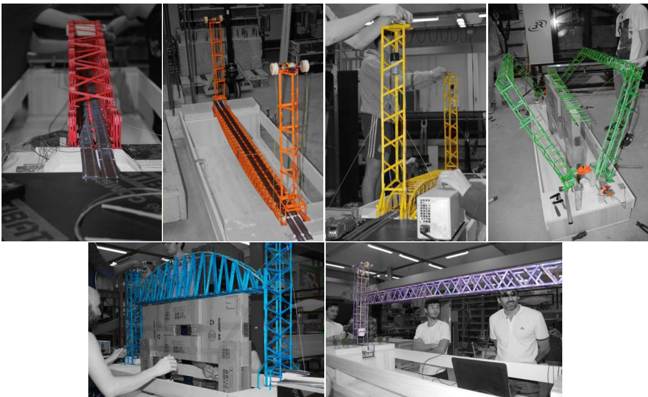
Figure 1: Les 6 ponts ferroviaires mobiles du défi Move Your Bridge

L'objectif du défi Move Your Bridge est de concevoir et réaliser une maquette de pont ferroviaire de 130,5 m de portée à la fois mobile et éco-responsable. La ressource « Move Your Bridge - défi étudiants » [1] présente le contexte et les grandes étapes du projet de conception et réalisation d'un pont mobile ferroviaire éco-responsable accompli par six groupes de quatre étudiants. La ressource « Move Your Bridge - cahier des charges » [2] détaille les informations reçues par les six équipes en début de défi.