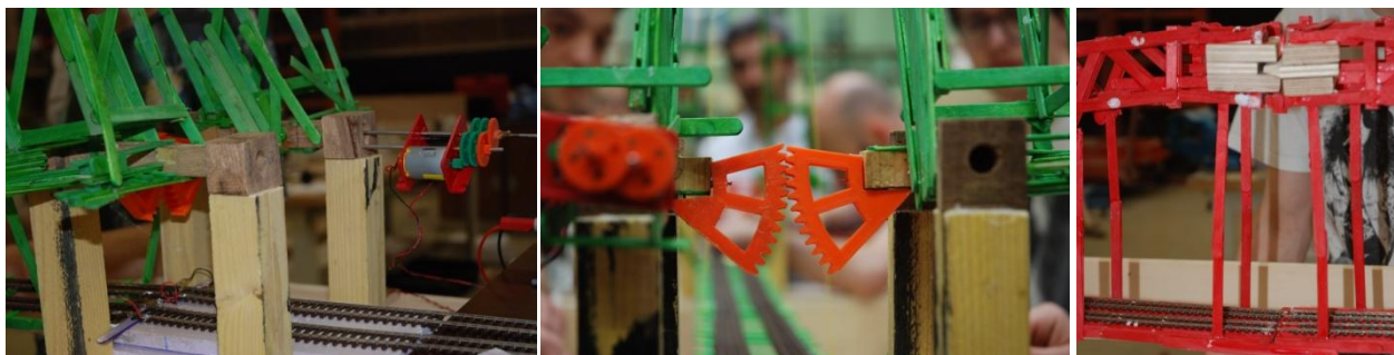
Figure 3 : Détails des pivots du pont vert et des engrenages ; guidage du tablier pont rouge

On remarque dans le tableau 3 la grande disparité des masses de bois ajouté. L'équipe pont vert détient le record de plus de 1,1 kg, la réalisation des pivots des arches est en effet très massive (figure 3). À cette quantité importante de bois, il faut ajouter les masses des quatre portions d'engrenages réalisés en impression 3D servant à la synchronisation des deux arches. L'équipe pont rouge a ajouté plus de 800 g de bois principalement pour réaliser le guidage du tablier. Le pont rouge est un pont tournant en deux parties, il est nécessaire d'assurer à la fermeture un positionnement permettant la continuité des rails et la continuité électrique !