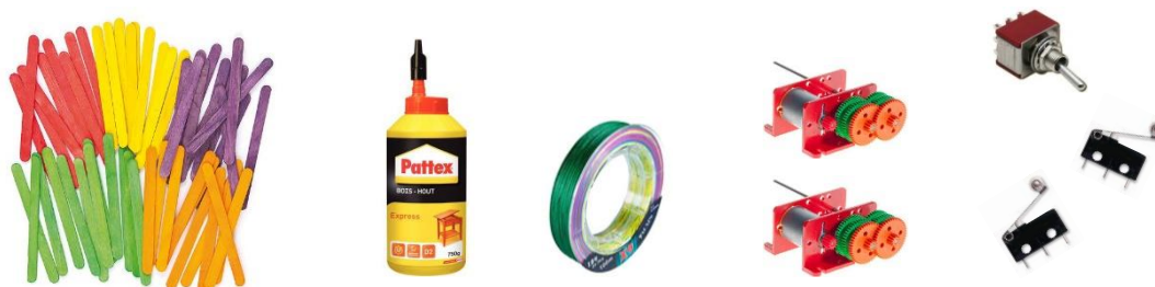
Figure 2 : Matériaux et matériels disponibles hors commande spéciale

Les équipes ont à leur disposition en début de projet un peu plus de 3 kg de bâtonnets, un pot de colle, du fil de pêche, 2 motoréducteurs, 1 interrupteur DPDT, 2 interrupteurs fin de course. D'autres matériaux et matériels peuvent être utilisés, ils seront également comptabilisés dans le bilan du coût carbone, leur choix doit donc être réfléchi.