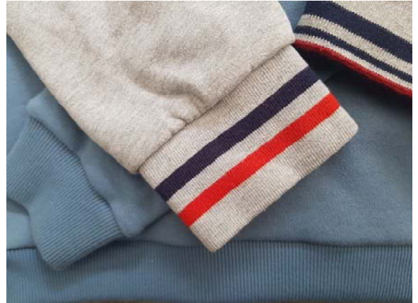
Bord-côtes rayé et uni de sweat.