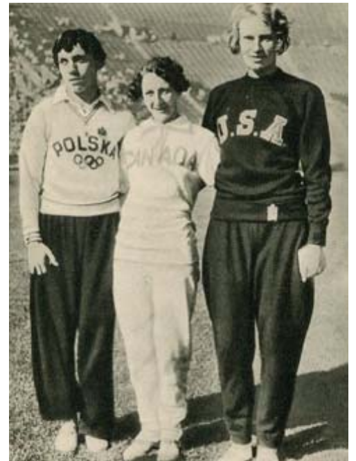
J.O. de Los Angeles, 1932