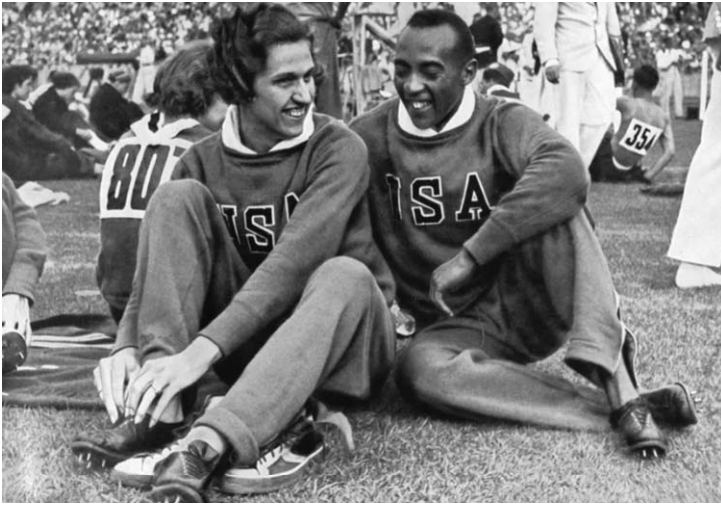
Helen Stephens et Jesse Owens. Jeux Olympiques de Berlin. 1936