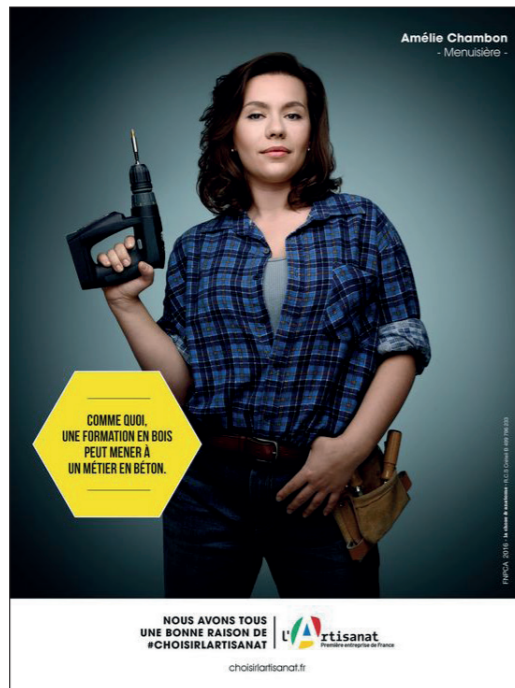
C. Affiche pour la promotion des métiers de l'artisanat, 2017, Agences La Chose et Anatome.