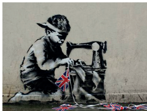
E. Banksy (1974-), Slave Labour (= travail d'esclave) , 2012, graffiti, 1m 2 , mur de Haringey dans le nord de Londres.

En 2008, Banksy réalise une version revisitée du tableau de Millet. Elle est maintenant assise au bord du cadre, cigarette à la main, et est également dans l'intervalle devenue une femme noire.