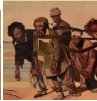
A. Ilya Répine (1844-1930), Les Bateliers de la Volga , 1870-1873, huile sur toile, 131,5 x 281 cm, Musée Russe, Saint-Pétersbourg.