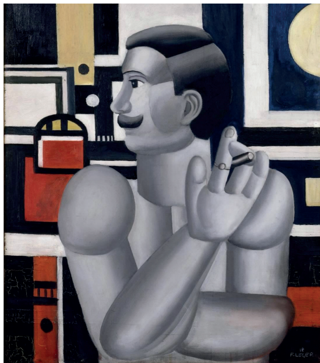
B. Fernand Léger (1861-1955) 1918, Le Mécanicien , huile sur toile, 116 x 88,8 cm, musée des Beaux-Arts du Canada à Ottawa.