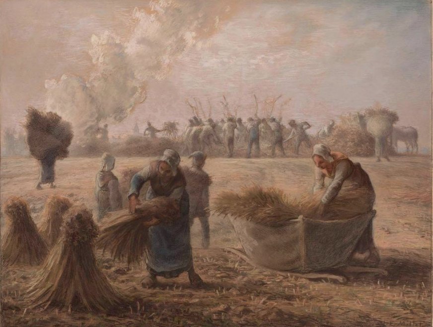
A. Jean-François Millet (1874-1875), Récolte de sarrasin , 1868, huile sur toile, 95,8 x 74 cm, musée des arts de Boston.