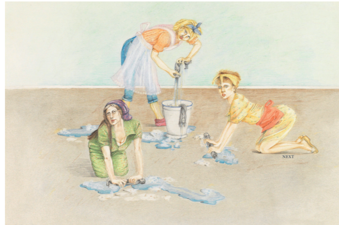
B. Birgit Jürgenssen (1949-2003) Bodenschrubben (récurer le sol) , 1975. Crayon noir et crayon de couleur sur papier artisanal, 43,5 x 62,5 cm, Rencontres Photographiques 2022, Arles.