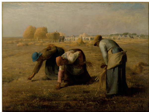
A. Jean-François Millet (1874-1875), Des glaneuses , 1857, huile sur toile, 110 x 83,5 cm, musée d'Orsay Paris.