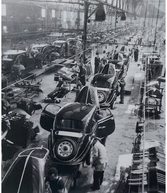
C. François Kollar (1904-1979), Chaîne de montage des automobiles Peugeot : montage des pare-chocs , usine Sochaux, 1931-1932, photographie.