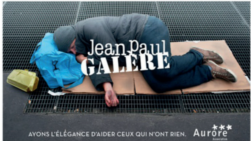
A. Campagne d'affichage urbain pour l'association Aurore « Ayons l'élégance d'aider ceux qui n'ont rien », 2015, réalisée par le photographe Rémi Noël (1963-), 70 x 100 cm.

Créée en 1871, l'association française Aurore a pour but la réinsertion sociale et professionnelle de personnes en situation d'exclusion et/ou de précarité.