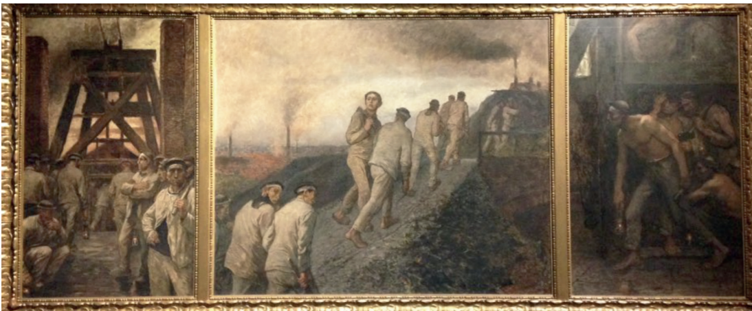
D. Constantin Meunier (1831-1905), La Mine : La Descente ; Le Calvaire ; La Remonte , 1902, huile sur toile, panneau central : 140 x 170 cm, panneaux latéraux : 140 x 85 cm, Musée Constantin Meunier à Bruxelles.

1.9 / Relevez trois éléments picturaux (au total) qui traduisent la pénibilité du travail dans les œuvres de Ilya Répine et Francisco Goya. (documents A et B) ... / 1,5 pt