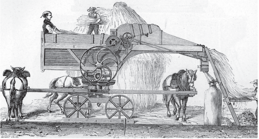
B. Dictionnaire d'arts industriels. Essor du machinisme avec la révolution agricole : une batteuse en 1881.

1.1/ Observez les documents A, B et C. Résumez le contexte économique et social avant et après la révolution industrielle en France. ... / 2 pts