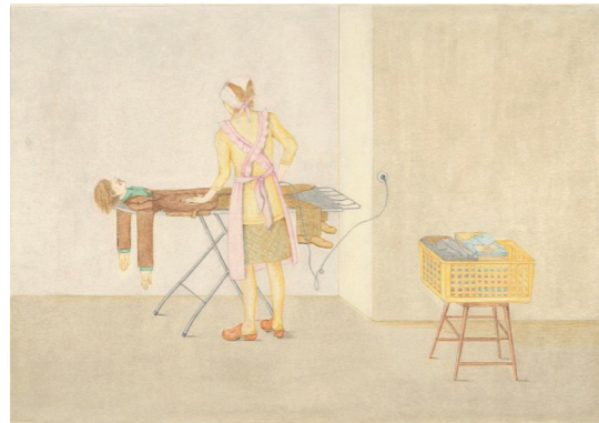
A. Birgit Jürgenssen (1949-2003) Housewives working (femmes au foyer travaillant) , 1972, dessin sur papier artisanal, 43,5 x 62,5 cm, Rencontres Photographiques 2022, Arles.