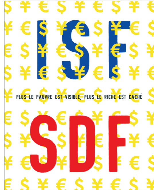
B. Gérard Paris Clavel (1943-), « ISF SDF - Plus le pauvre est visible, plus le riche est caché », 2007, Tirages sur bâche 55 x 77 cm, Coproduction le journal Manière de voir –

Créée en 1871, l'association française Aurore a pour but la réinsertion sociale et professionnelle de personnes en situation d'exclusion et/ou de précarité.