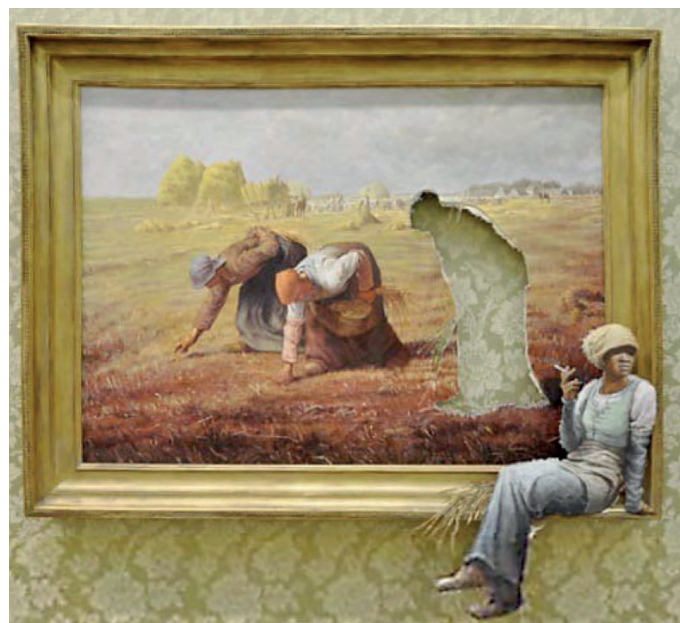
D. Banksy (1974-), Des glaneuses , 2008, huile sur toile + collage, Musée de Bristol.

En 1908, Lewis Hine travaille pour le National Child Labor Committee et réalise de nombreuses photographies. En 1910, il s'inspire de la toile de Millet et réalise la photographie des « Petites cueilleuses de canneberges ».