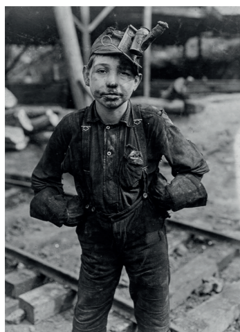
C. Lewis Hine (1874-1940), Tipple boy à la mine de charbon , 1908., photographie, Fondation Cartier Paris.

En 1908, Lewis Hine travaille pour le National Child Labor Committee et réalise de nombreuses photographies. En 1910, il s'inspire de la toile de Millet et réalise la photographie des « Petites cueilleuses de canneberges ».