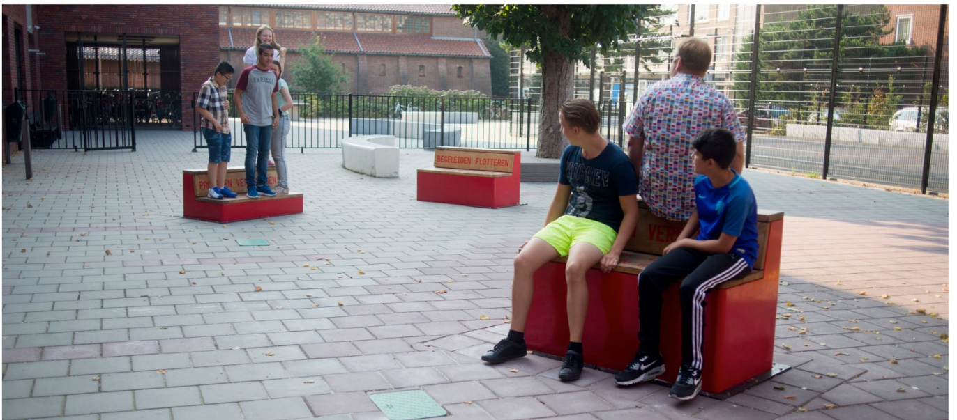
3. Rogier MARTENS , architecte, Floaters , Groupe de bancs reliés par un système hydraulique, La Haye, Pays-Bas, 2018.

Floaters [traduction proposée : les flotteurs ] est un groupe de bancs placés dans une cour d'école publique, permettant aux utilisateurs d'interagir et leur offrant la possibilité d'apprendre quelque chose en même temps. Lorsque qu'une personne s'assoit sur un des bancs, celui-ci s'abaisse lentement jusqu'au sol. À un autre endroit dans la cour d'école, c'est le contraire qui se produit. Grâce au dispositif, chaque utilisateur prend conscience de sa place au sein du groupe et facilite la communication.