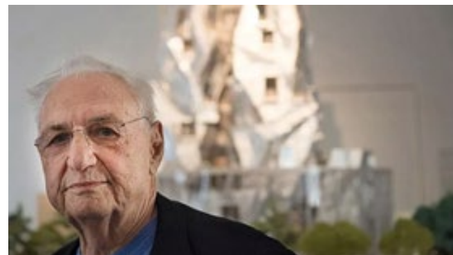
Frank GEHRY, devant la maquette de la Tour LUMA, à Arles