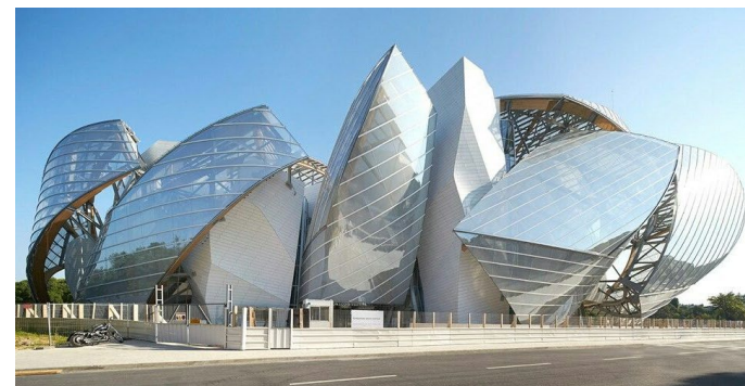
Frank GEHRY, Fondation Vuitton, 2014

Deux mots issus du vocabulaire afin de décrire le bâtiment :