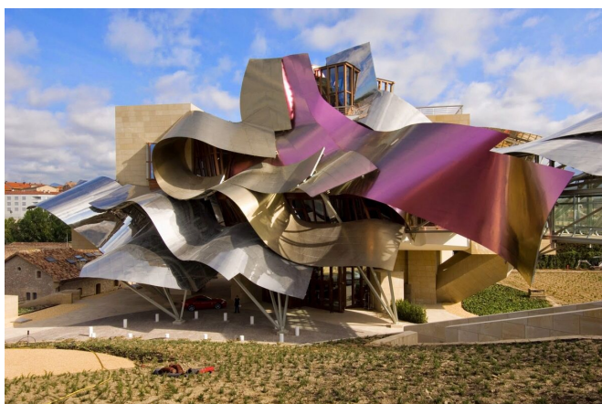
Frank GEHRY, Hôtel Marqués de Riscal, 2006

VOCABULAIRE : massif, transparent, ondulé, cranté, ruban, spiralé, dressé, facetté, anguleux, envol, dense, souple, emmêlé, pointu, asymétrique, voile, en équilibre, brillant, lisse, compact, fragmenté, minéral, végétal, reflet, gonflé, légèreté, déstructuré.