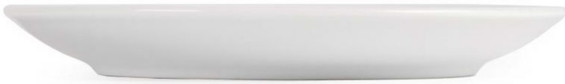
Assiette vue de côté