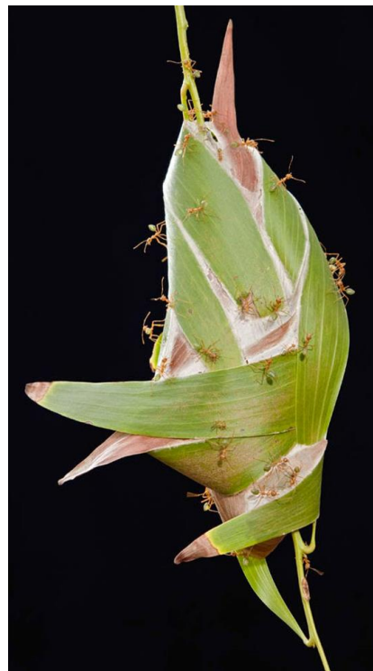
Nid de fourmis