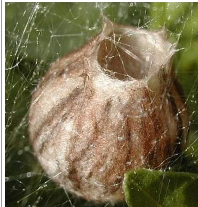
Cocon d'araignée frelon