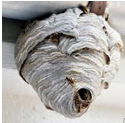
Nid de guêpes