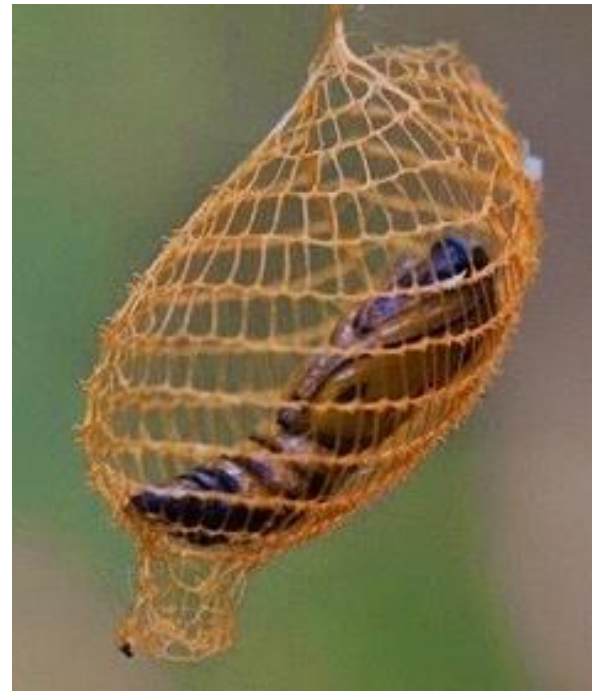
Cocon de papillon