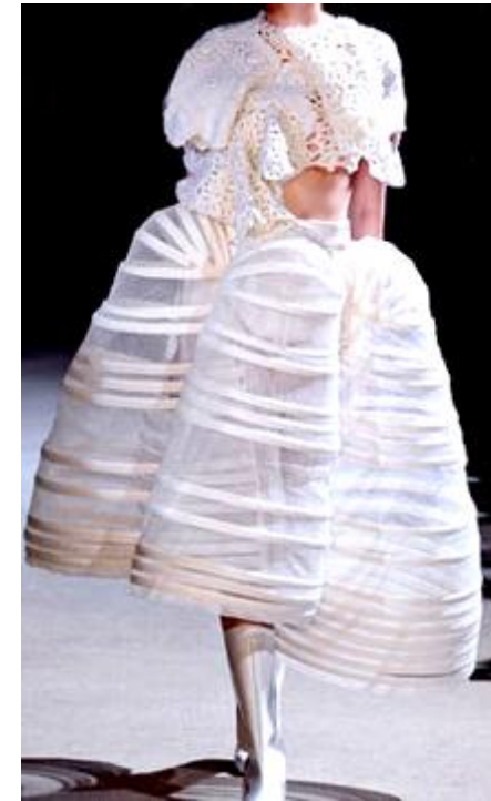
Tenue comme des garçons, 2012