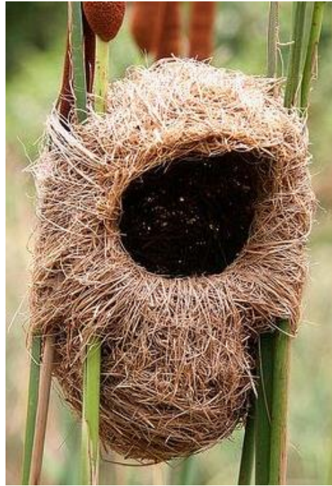
Nid de la rousserolle effarvate