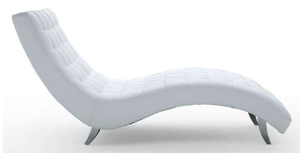
Archiexpo méridienne contemporaine « Ginger »

Sanglage élastique Garniture mousse Hauteur des côtés du fût : 10 cm Couverture passepoilée haut et bas Matelassage du plateau selon le dessin technique Jaconas et dos extérieur assemblés machine