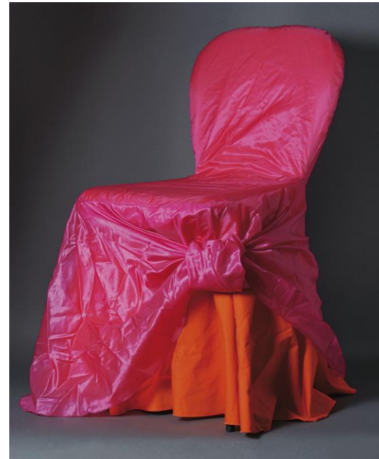
Tord BOONTJE - doll chair