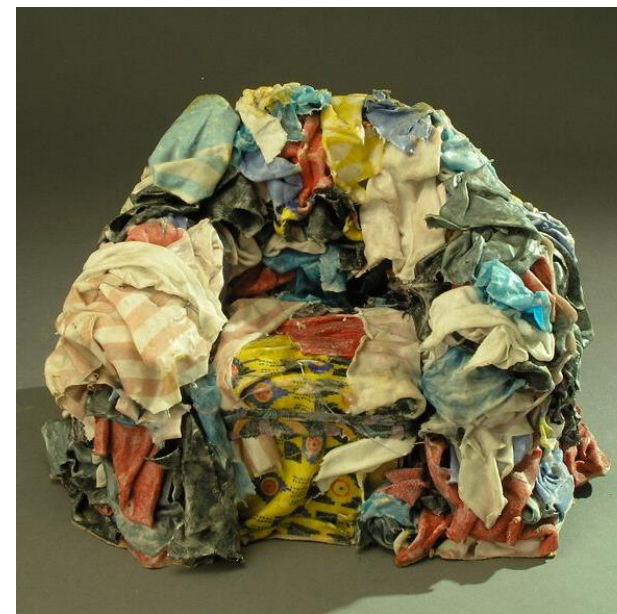
Gaetano PESCE - "rag armchair", morceaux de tissus et résine. Allouche Gallery, 1970