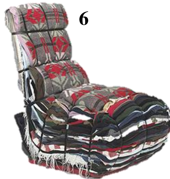
Tejo REMY - rag chair Droog Design