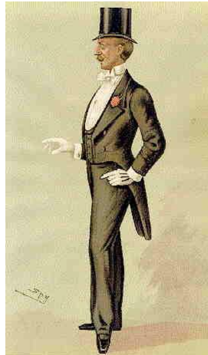
3. Gravure de mode masculine. Homme portant un frac ( veste d'homme à queue de pie ) et chapeau haut de forme. Deuxième moitié du XIX ème siècle.