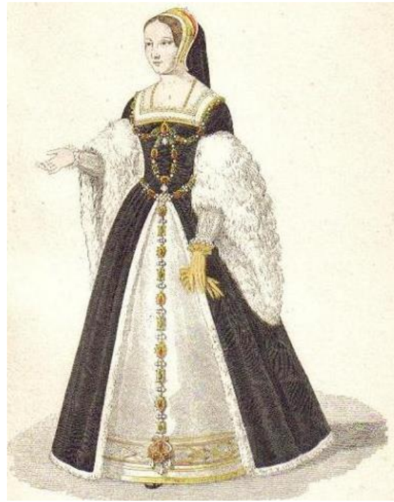
2. Gravure représentant Claude, reine de France, épouse de François 1 er . Début du XVI ème siècle.