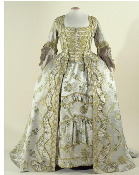
4. Robe à la française, tournure à paniers qui donne le volume. XVIII ème siècle.