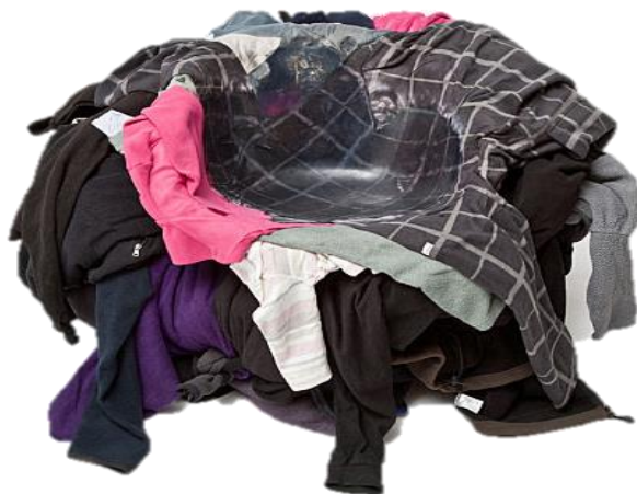
Tom PRICE - chaise en molleton de polyester fondu, 2009