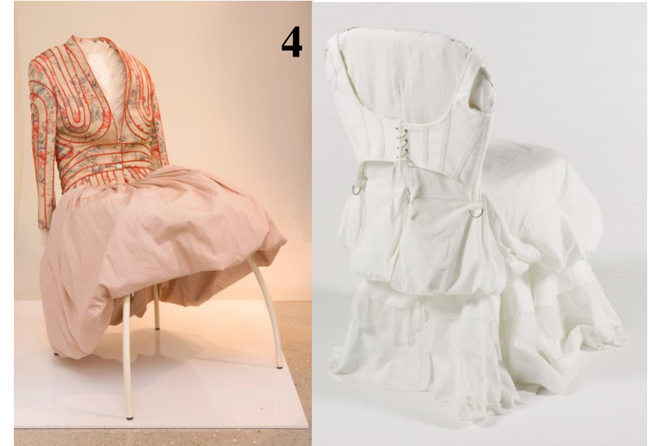
Tord BOONTJE - chaises habillées Carousel, pour Alexander MC QUEEN