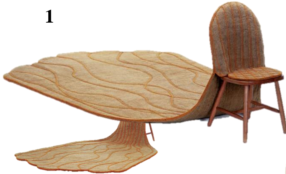
Florence DOLEAC - la chaise mise à nu, 2002