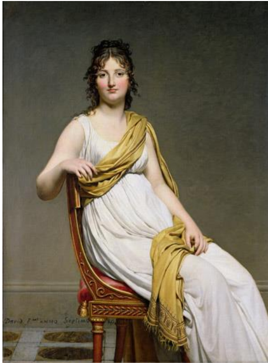
1. Mme RECAMIER, Jacques Louis DAVID. Fin du XVIII ème siècle. Costume antique.

Attribuer dans le tableau page 2/5, chaque vêtement au siècle correspondant.