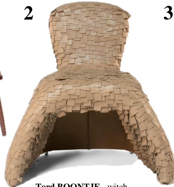
Tord BOONTJE - witch