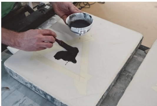
Illustration 3 : étape de la lithographie

LOYER Charles in https://etapes.com/avec-12-500-couvertures-uniques-novum-fait-la-une/ consulté le 14/11/2020 à 12h00.