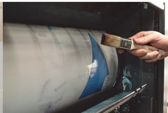
Illustration 4 : interventions sur l'offset