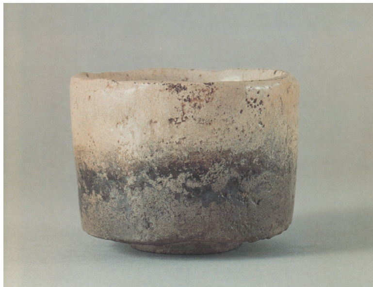
Illustration 1: Bol à thé, KŌETSU Hon'ami, XVII e siècle

Sabi : altération par le temps, patine des objets. Voir illustration 1.