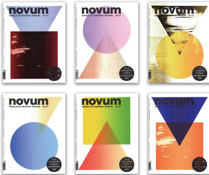
Illustration 2 : six couvertures de Novum parmi les 12500 réalisées

« Aussi efficace qu'un algorithme, le Studio Marcus Kraft vient de réaliser 12 500 couvertures uniques pour le numéro de mars du magazine Novum. Aucun calcul savant, mais quelques interventions manuelles bien placées en plein processus d'impression.