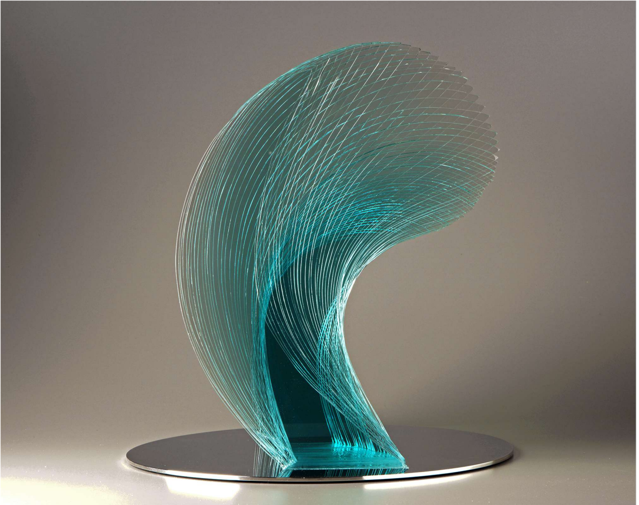
Niyoko IKUTA , artiste verrier japonais, Swing-121 , verre plat, L : 39 x l : 39 x H : 41 cm, 2011.