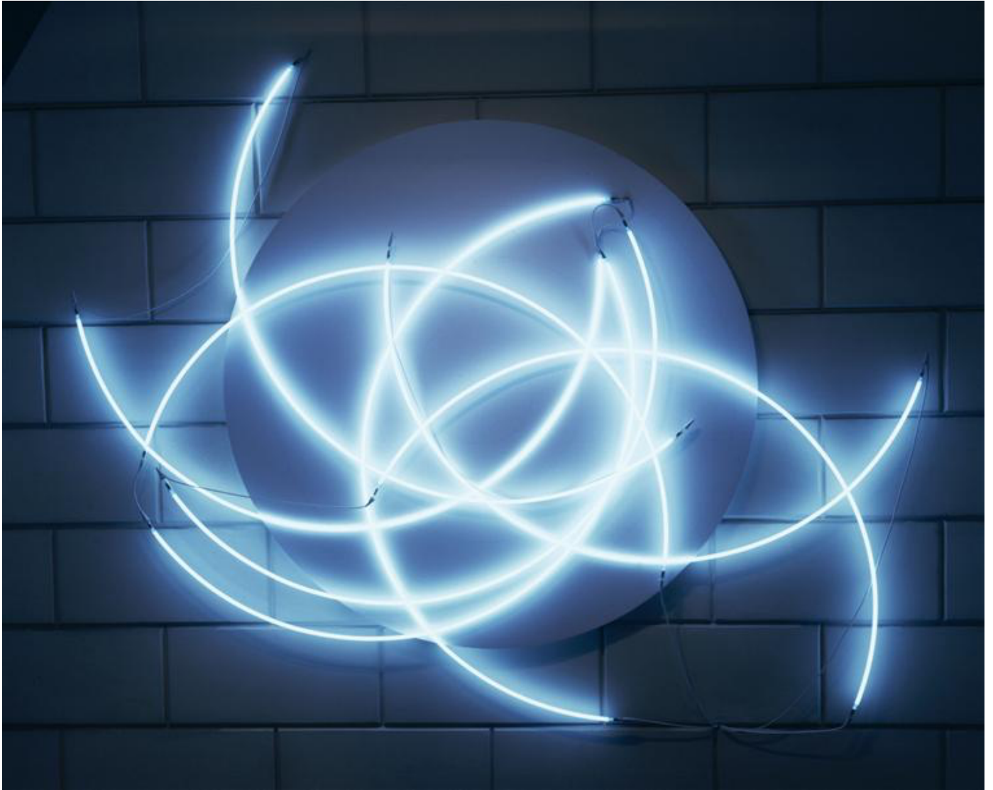
François MORELLET , plasticien, Lunatique Neonly n°1 , huit néons en demi-cercle, 256 x 303 cm, musée des Beaux-Arts de Rennes, 1997.