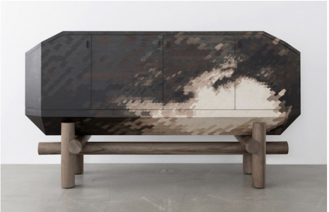
Benjamin GRAINDORGE , designer, Cloud in Chest , buffet, Paris 2018. Ce buffet est marqueté de 3 000 pièces de 16 essences de bois représentant des nuages pixellisés.