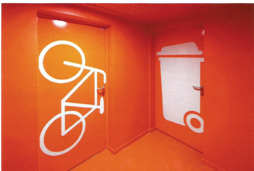
Agence VOUS ÊTES ICI ARCHITECTES, 11 logements sociaux avec jardin, Rue Mouffetard, Paris, 2014.