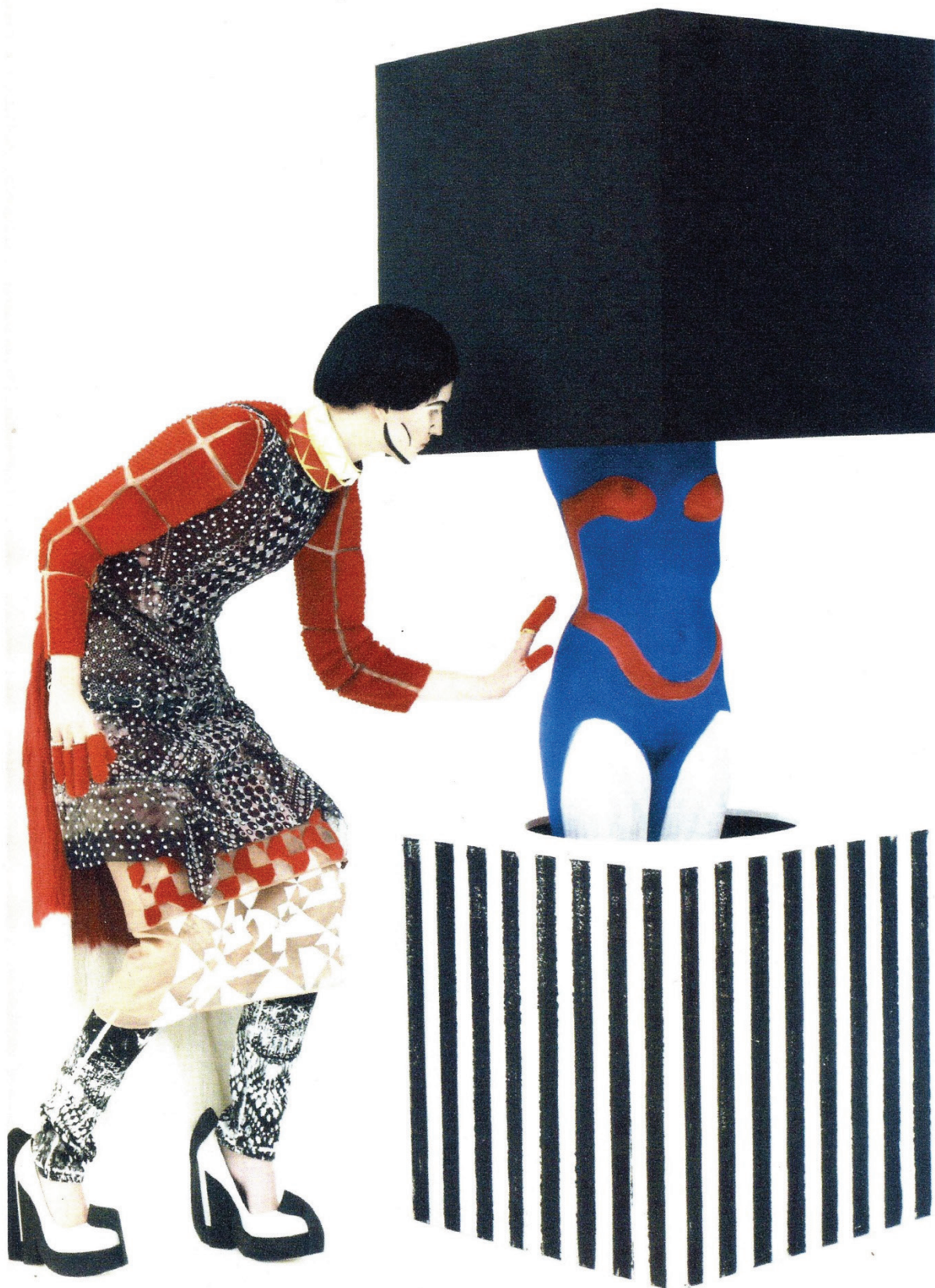
BLOMMERS AND SCHUMM, photographie de la série de mode réalisée par VANESSA REID, Pop Magazine, numéro 30, printemps-été 2014.