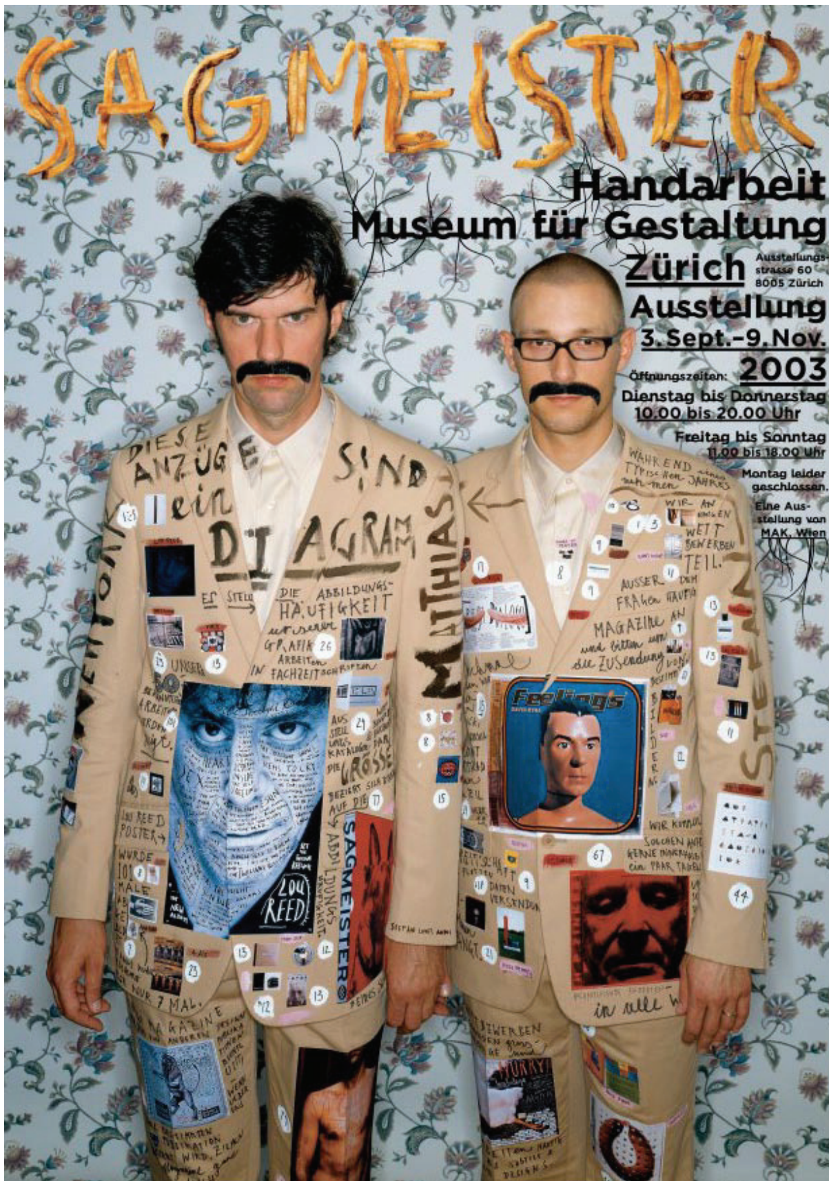
STEFAN SAGMISTER, affiche de l'exposition Handarbeit (« travail à la maison »), Museum für Gestaltung, Zurich, 2003.