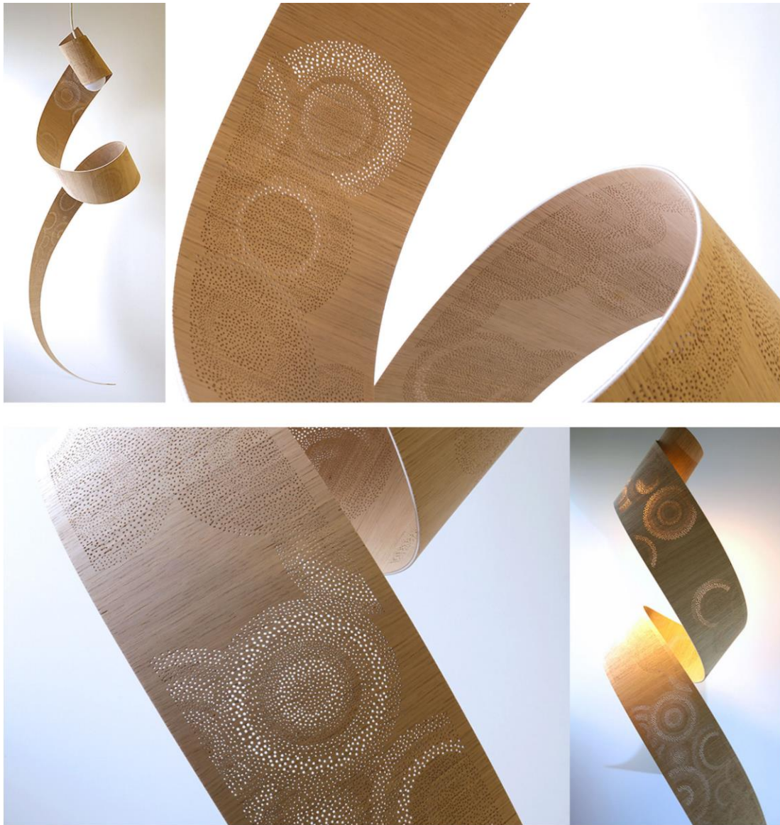
Steven LEPRIZÉ , designer et ébéniste, COPAL lampe en bois thermoformé, éditeur ARCA. contreplaqué de chêne, vernis PVC, 300 x 1000 mm, 2017.