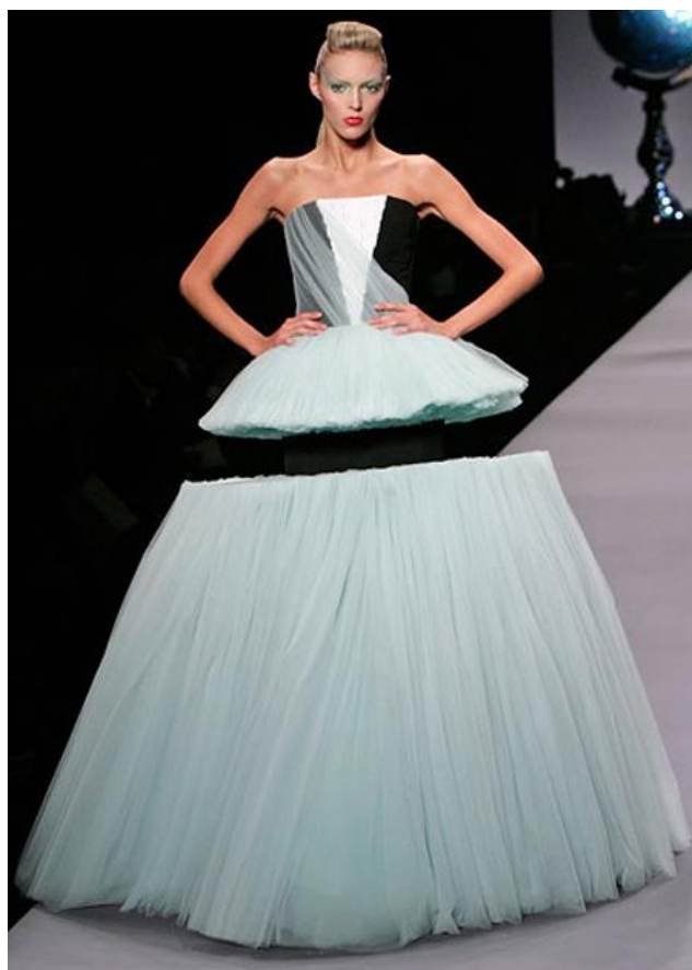
VIKTOR & ROLF , Chainsaw-hacked tulle dresses , proposition de traduction : robes de tulle taillées à la tronçonneuses, collections printemps-été 2010.