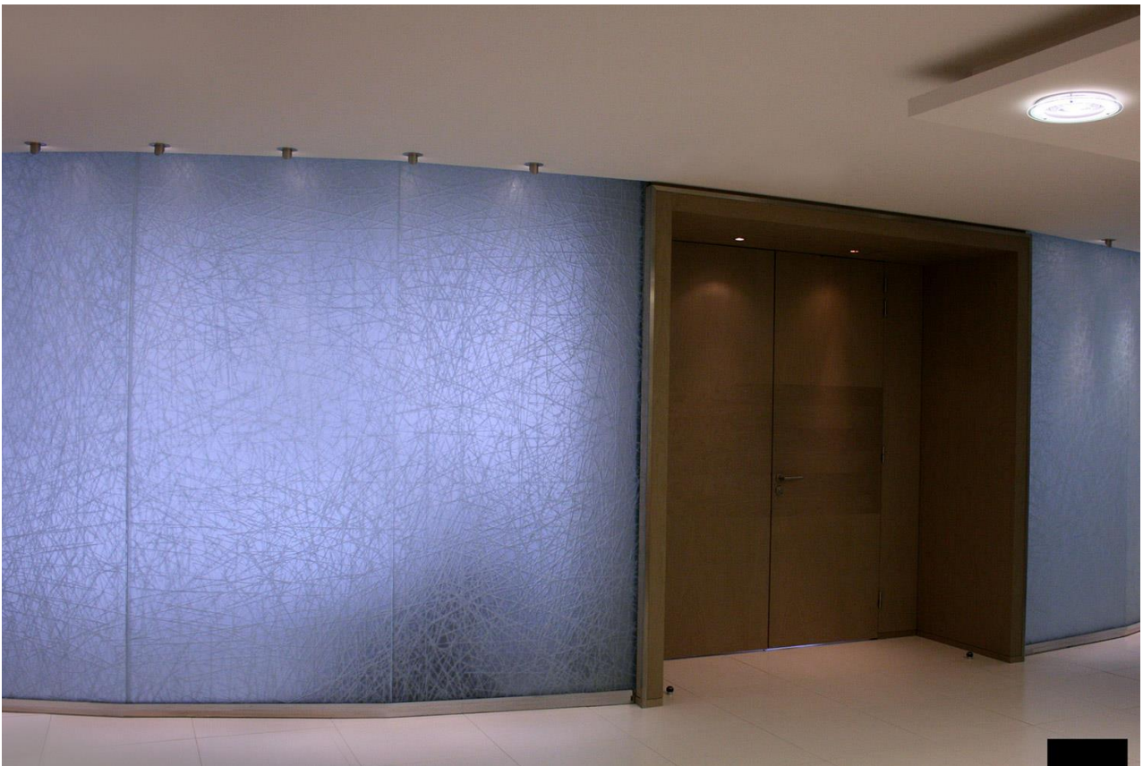
Ateliers Bernard PICTET , cloison gravée et sablée, années 2010.