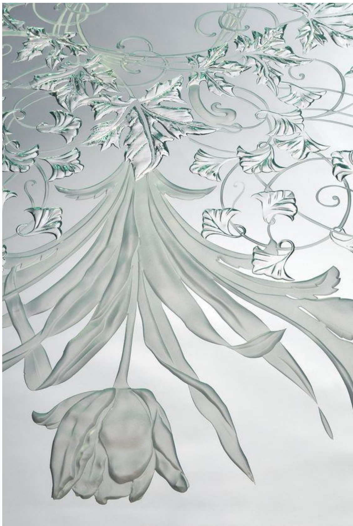
Eric BONTE, maître verrier, plateau de table, détail, France Vitrail International, années 2010.