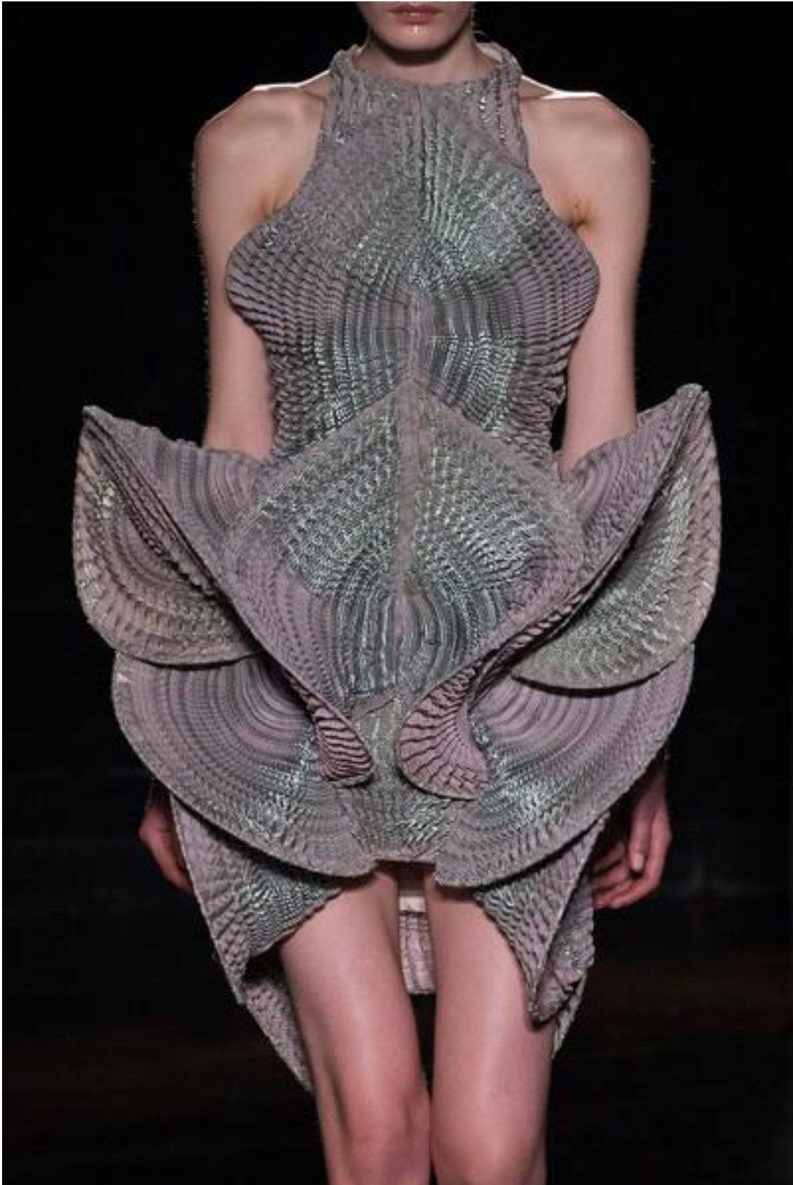
Iris VAN HERPEN, créatrice de mode, robe de la collection automne hiver 2016.