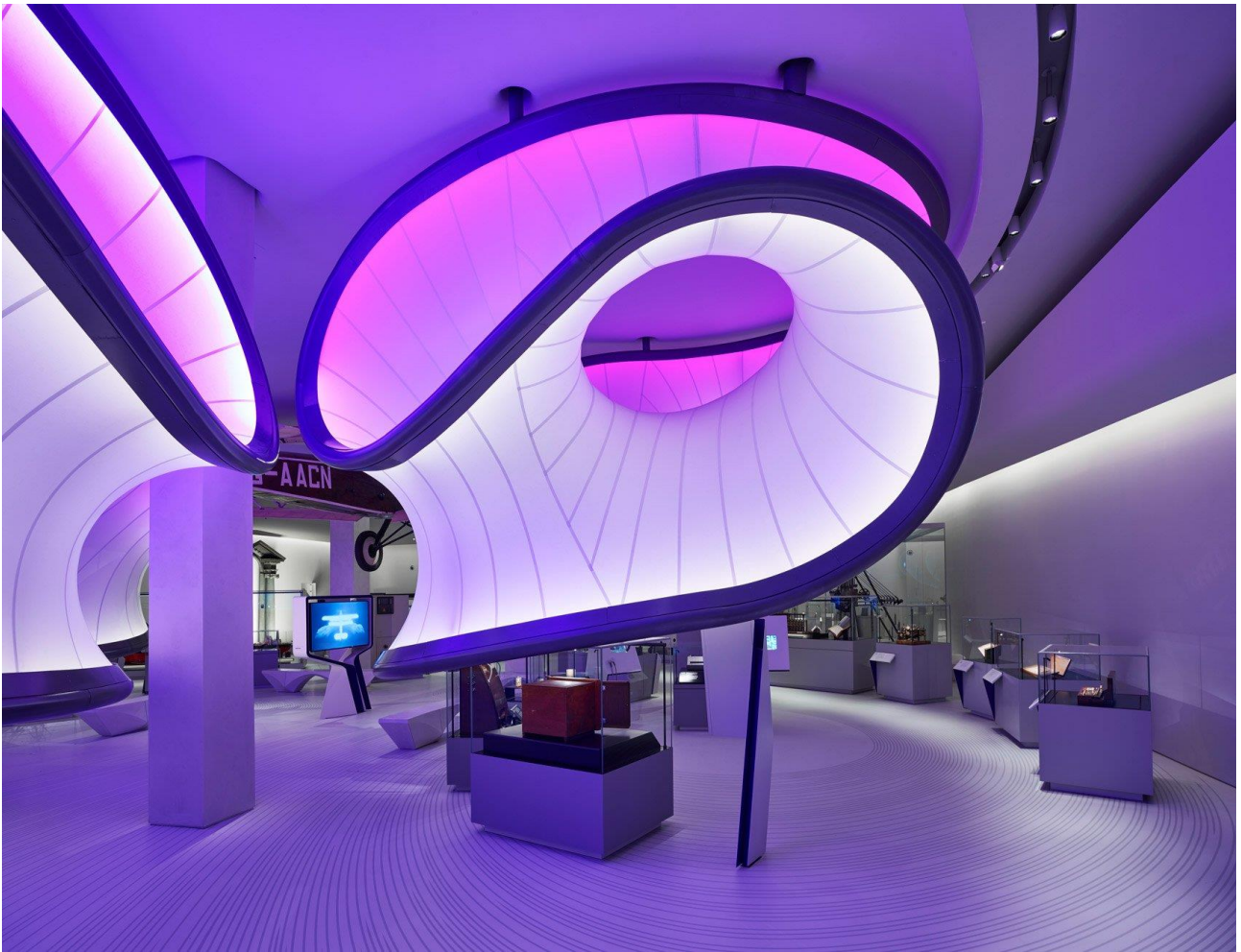
Zaha HADID , architecte urbaniste, galerie des mathématiques au Musée des Sciences à Londres, décembre 2016.