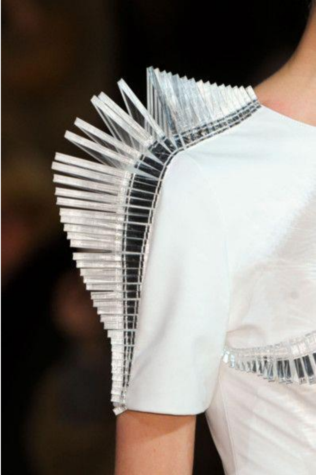
Iris VAN HERPEN, Collection printemps été 2012.