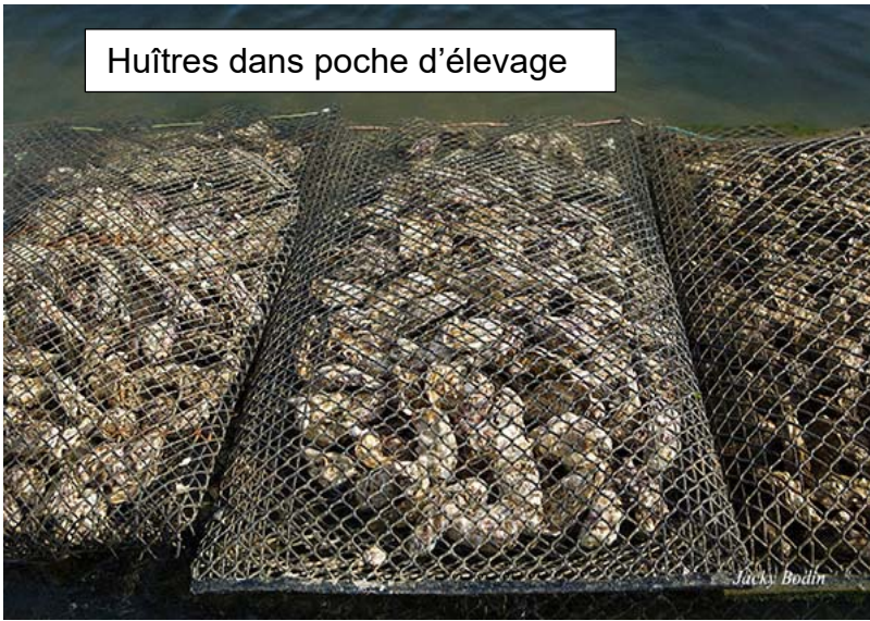
Huîtres dans poche d'élevage

La partie non vendue des huîtres est remise en poches d'élevage pour une troisième année (275 unités par poche soit 11 kg). A l'issue de cette année, les huîtres sont retirées de l'eau de mer au fur et à mesure des besoins des ventes, les invendus pouvant rester une année de plus en culture, l'ostréiculteur s'arrangeant pour que ce soient les huîtres les plus petites.