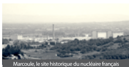
Marcoule, le site historique du nucléaire français