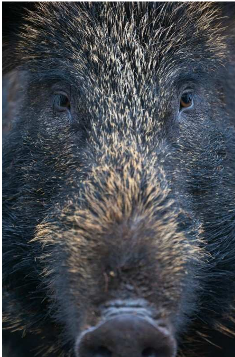
Un sanglier sur trois présente des niveaux élevés de radioactivité dans la région de la Saxe (Allemagne).

Vingt-huit ans après la catastrophe nucléaire de Tchernobyl , survenue en avril 1986 en Ukraine, les sangliers d'Allemagne gardent encore dans leur chair le souvenir de l'explosion de la centrale. Un tiers des porcs sauvages qui peuplent les forêts de la Saxe sont radioactifs.