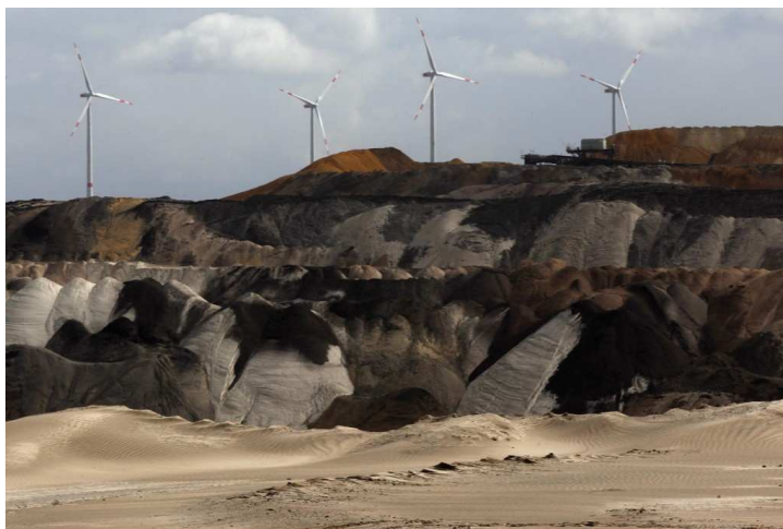
La mine de lignite à ciel ouvert de Garzweiler, près de Cologne, en avril. Au deuxième plan, des éoliennes.

La sortie du nucléaire en 2022 sera forcément l'un des chantiers majeurs du futur gouvernement. Le sujet a donc droit à un groupe de travail spécifique dans les négociations que mènent actuellement l'Union CDU/CSU et le SPD. Côté CDU, c'est Peter Altmaier qui pilote la délégation. Normal, il est ministre de l'environnement. Côté SPD, c'est Hannelore Kraft. Un choix qui est tout sauf neutre.