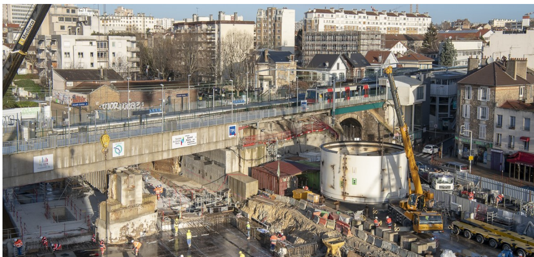
Chantier de la gare Arcueil-Cachan