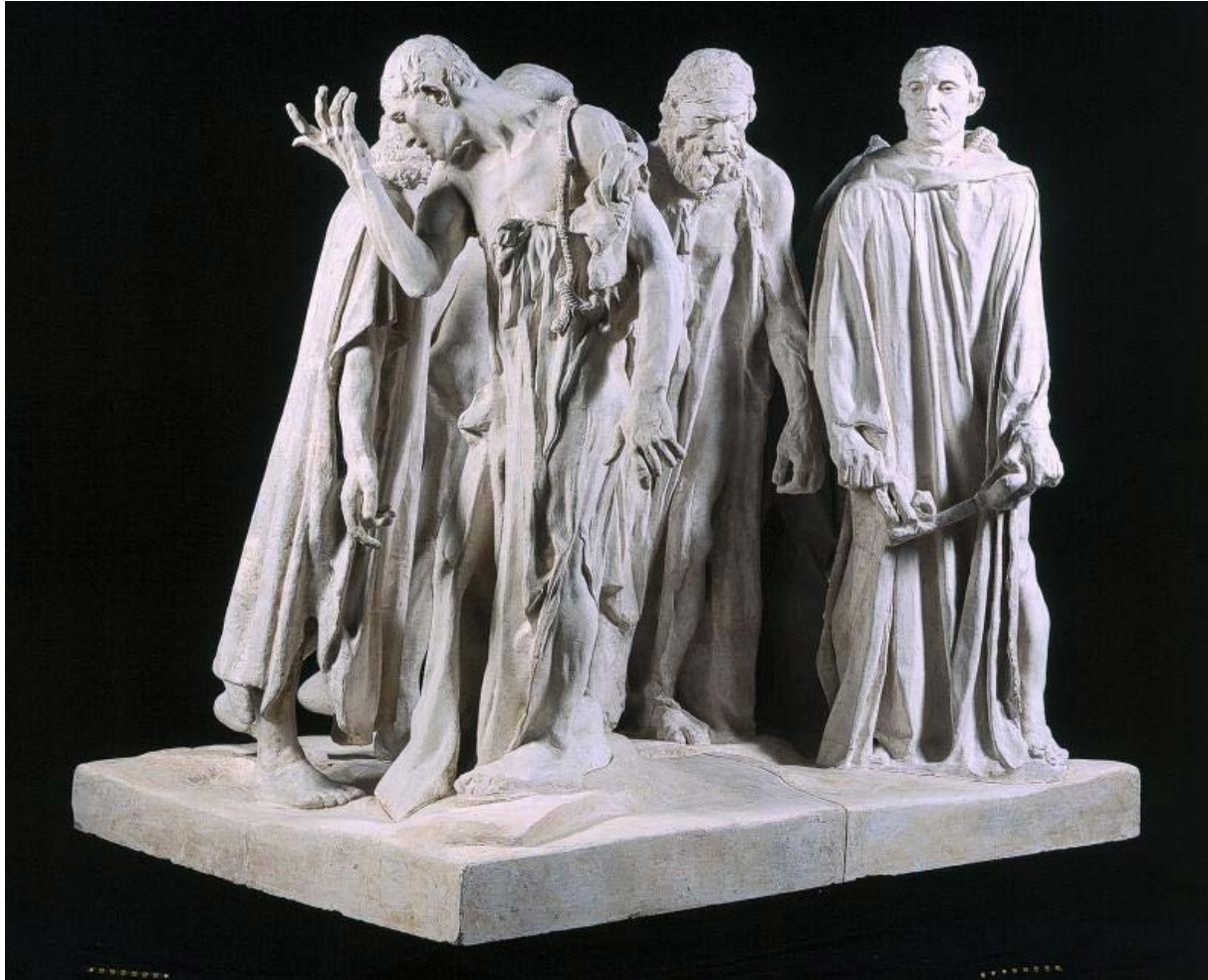
Auguste RODIN, Les Bourgeois de Calais , 1884-1886, plâtre, H. 219,5 cm ; L. 266 cm ; P. 211,5 cm. Musée Rodin, Paris.