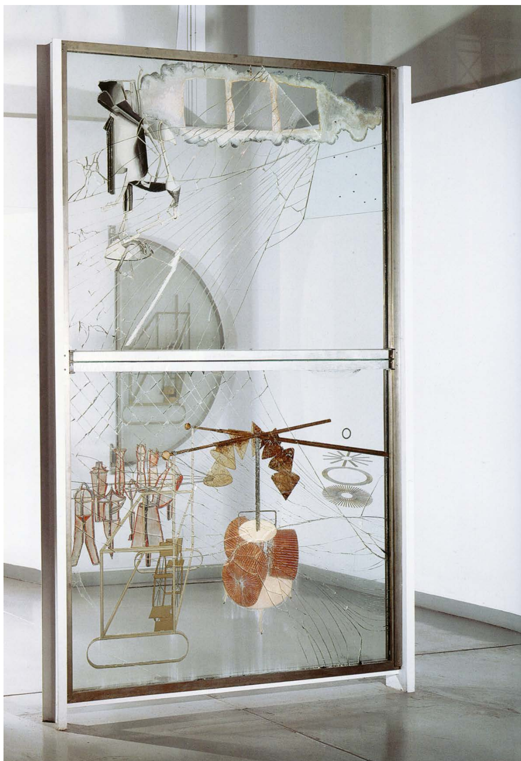
Marcel DUCHAMP, La Mariée mise à nu par ses célibataires, même (Le Grand Verre) , 1915-1923, huile, vernis, feuille de plomb et poussière entre deux panneaux de verre montés sur aluminium, bois et cadre en acier, 227,5 cm x 175,9 cm. Philadelphia Museum of Modern Art, Philadelphie.