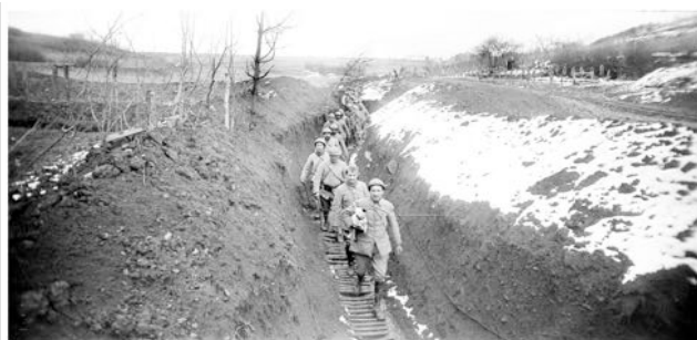
Établissement de communication et de production audiovisuelle de la Défense, 2011