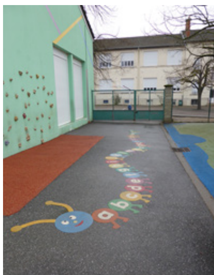
L'entrée de l'école