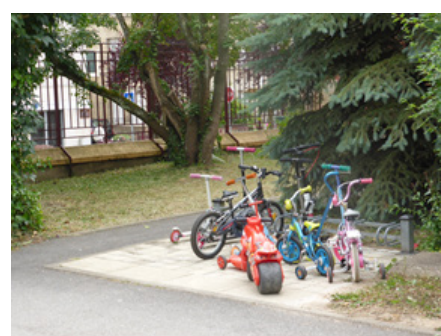
Le garage des trottinettes