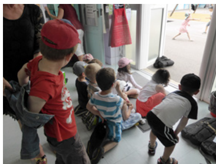
Devant la porte de la cour