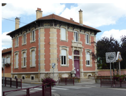
L'école depuis la rue