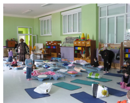
... qui sert aussi pour la sieste.