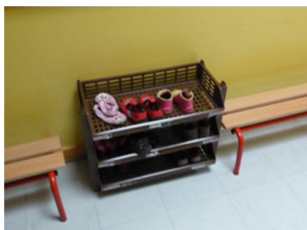
Le rangement à chaussons ou à chaussures devant la classe