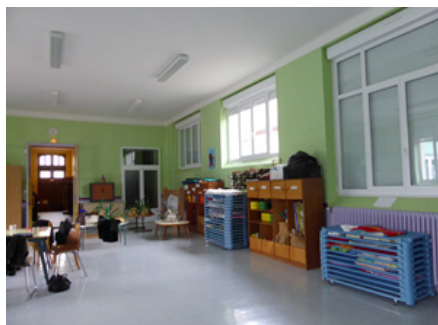
Le hall d'entrée de l'école ...