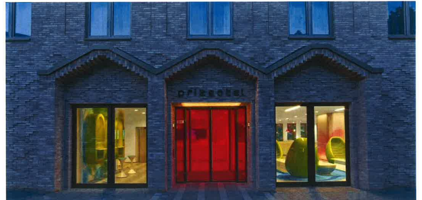
Prizeotel, Brême Allemagne - Design Karim Rhashid.