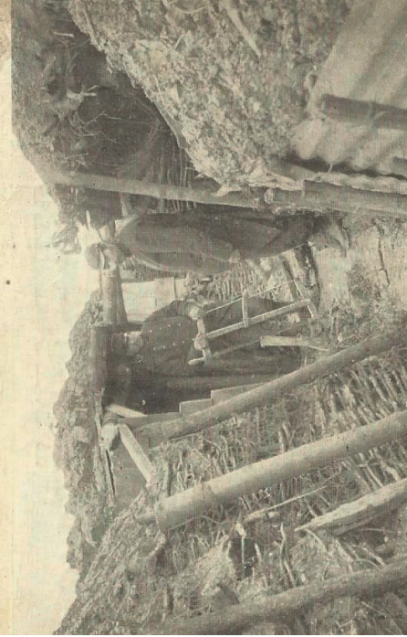
La Première Guerre mondiale