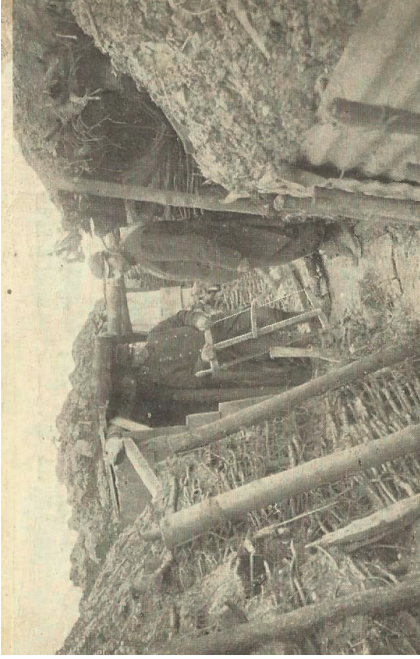
La Première Guerre mondiale