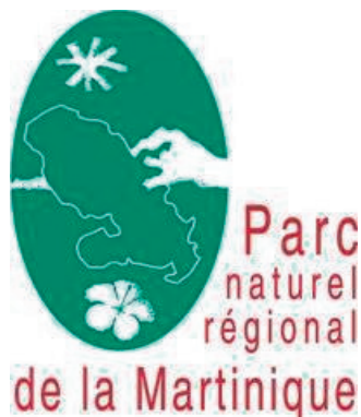
Parc naturel régional de la Martinique