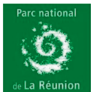
Parc national de La Réunion