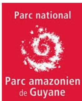
Parc national amazonien de Guyane