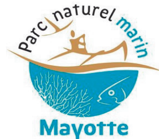
Parc naturel marin Mayotte