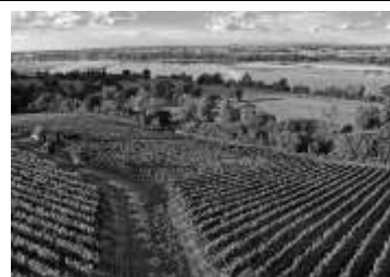
N°4 Viticulture près de la Loire