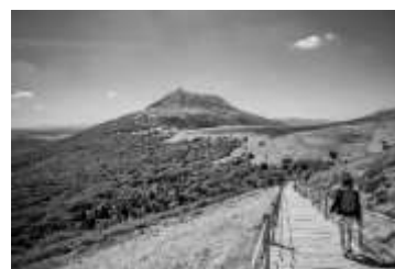
N°6 Randonnée dans le Massif Central