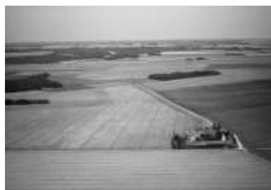
N°2 Culture céréalière en Beauce, près de Paris