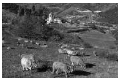
N°3 Elevage extensif dans les Pyrénées