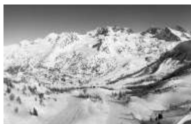
N° 1 Station Isola 2000 dans les Alpes

Rappel de la consigne : pour chaque photographie d'espace de faible densité, inscrivez dans les cadres sur la carte le numéro lui correspondant.