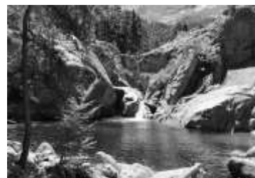
N°5 Parc naturel régional de Corse