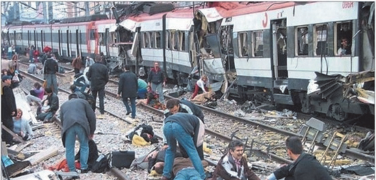
Decenas de heridos permanecen junto a las vías instantes después de abandonar el tren que sufrió el atentado en las proximidades de la estación de Atocha.

Interior * investiga la pista de Al Qaeda sin descartar a ETA