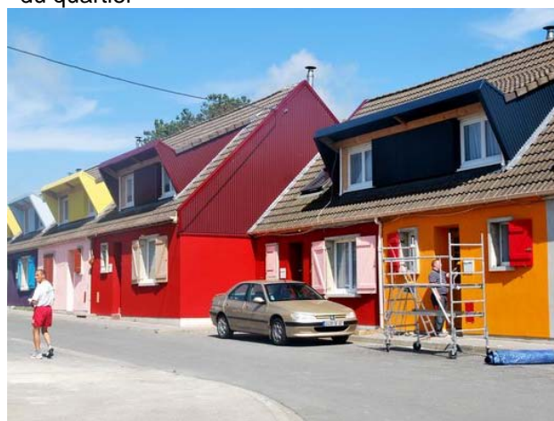
4. Restauration des façades des maisons du quartier de Boulogne-sur-mer.