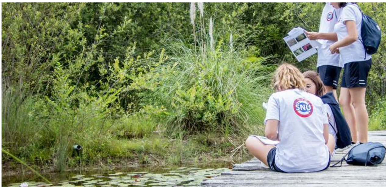
Jeunes volontaires participant à un parcours biodiversité – Centre SNU Cap découverte du Tarn

Ce module vise à sensibiliser aux enjeux planétaires, notamment écologiques, de la gestion des ressources en énergie. L'élève acquiert des connaissances sur l'exploitation des ressources et la consommation des énergies. Il est sensibilisé aux économies d'énergie.