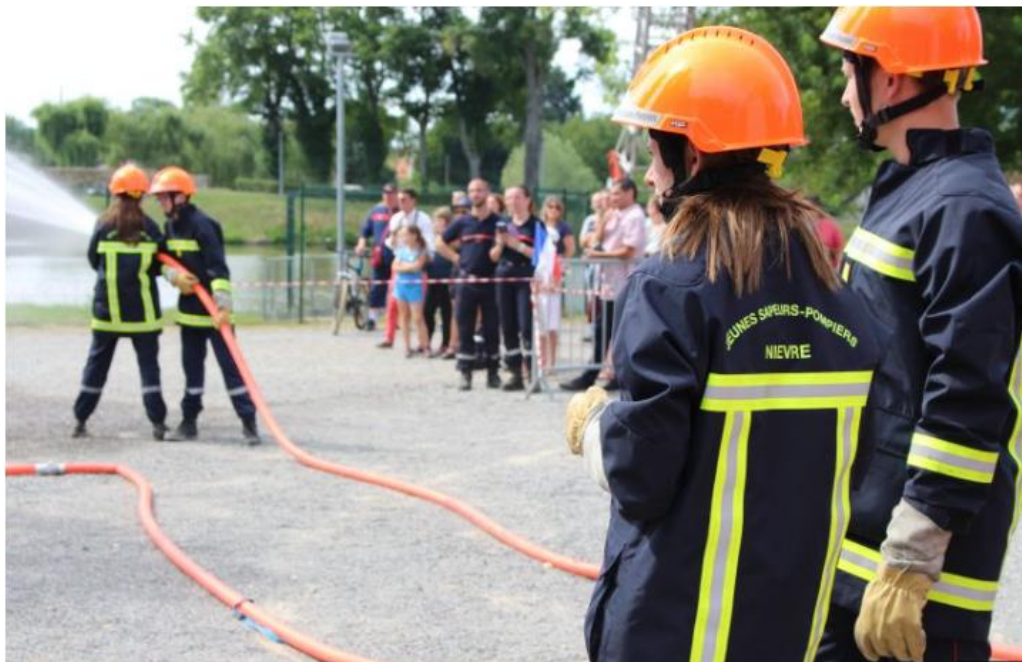
Jeunes sapeurs-pompiers en formation avec le SDIS 58.