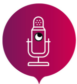
LA FABRIQUE À CHANSONS