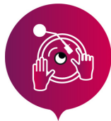
LA FABRIQUE ELECTRO