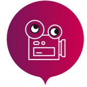
LA FABRIQUE MUSIQUE ET IMAGE